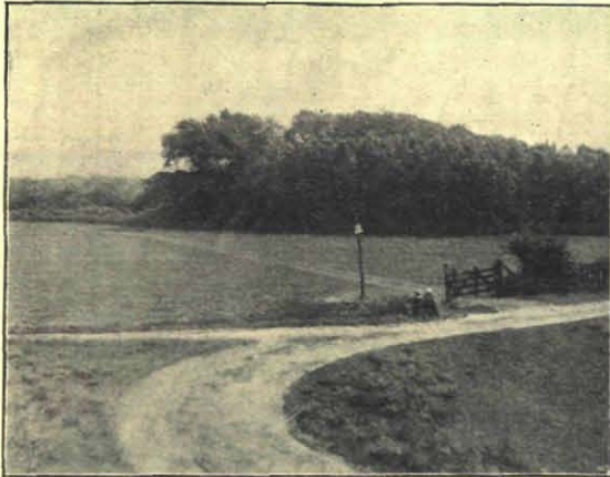
Foto 1. Toegangen tot Staalduinen.

En welke mycoloog zou niet watertanden bij de gedachte aan de paddestoelenweelde, die zulk een humeus en vochtig, oud gemengd bosch in den herfst tentoonspreidt?