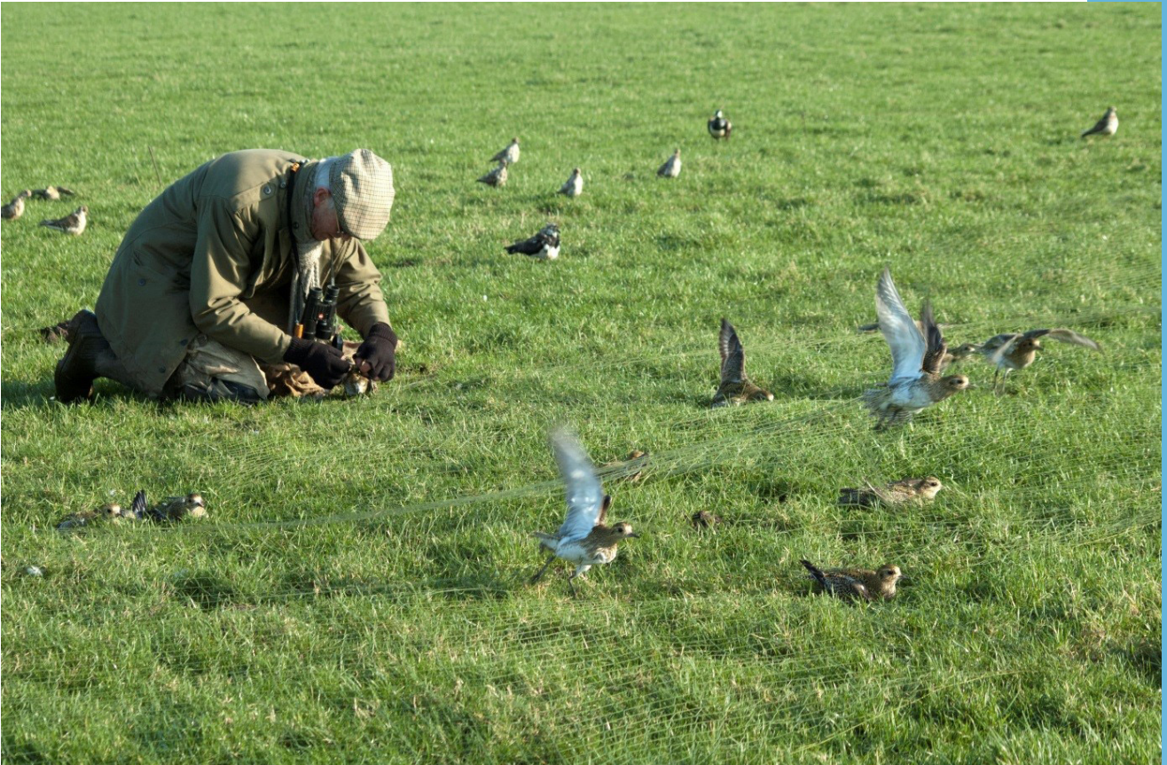
Figuur 1. Arend Veenstra in de weer met enkele gevangen wilsters in De Drie Polders op 15 januari 2007.

Als je weer thuis bent, probeer je er snel achter te komen waar de reeds geringde vogels vandaan komen en wie ze geringd hebben. De ene goudplevier was geringd op 26 oktober 2005 te Oudega (bij Sneek) door de heer A. van der Veen uit Abbega, de andere goudplevier werd precies een jaar later geringd, op 26 oktober 2006, te Gerkesklooster door de heer H. Dijkstra te Munnikezijl. (Wel toevallig dat ik ook op 26 oktober deze gegevens boven water haal).