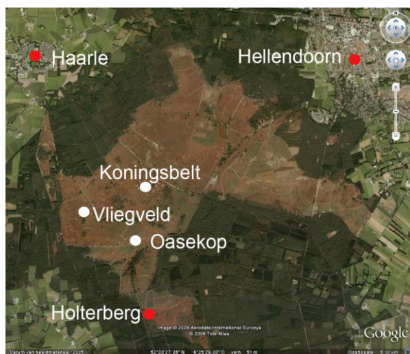
Kaart 1: Overzichtsfoto van de Haarlerberg.

Na het legen van de eerste potten op 11 mei 2006 werd het onderzoek afgebroken. De vrijwilligers die de potjes leegden troffen er namelijk ook hagedisjes in aan en braken daarom het onderzoek af. De spinnen werden wel gedetermineerd. In totaal zijn 43 soorten aangetroffen, waarvan elf soorten nieuw voor Overijssel. Van de elf waren de volgende acht al bekend uit de aangrenzende provincies Friesland, Drenthe en Gelderland: Zelotes electus , Cheiracanthium virescens , Clubiona trivialis , Walckenaeria atrotibialis , Walckenaeria acuminata , Alopecosa cuneata , Ero furcata en Aelurillus v-insignitus . Twee soorten waren al bekend uit Drenthe en Gelderland ( Zelotes petrensis , Talavera petrensis ), en Xysticus ferrugineus werd eerder gemeld uit Gelderland.