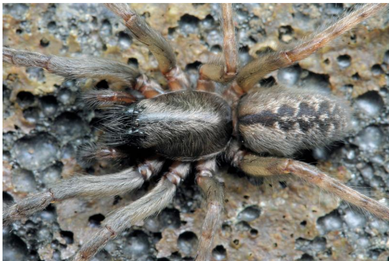
Fig. 1. Segestria bavarica uit Wageningen (2009).

Naast de waarnemingen op de Waddeneilanden bezaten wij zelf nog twee ongepubliceerde vondsten. De eerste betreft de flat van de eerste auteur in Wageningen, waar de spin werd gezien van 2006 tot 2010. Er zijn hier woonkokers in zeer veel spleetjes en gaatjes in de muur, van de begane grond tot de hoogste (derde) verdieping. De kortste afstand tussen twee woonkokers bedroeg zo'n 20 cm. Lokaal kan S. bavarica dus in zeer hoge dichtheden voorkomen. Ook elders in de wijk en in andere delen van Wageningen zijn woonkokers van deze soort gevonden. Ook in een muur van het woonhuis van de tweede auteur werd S. bavarica waargenomen, en wel een vrouwtje in het voorjaar van 1999.