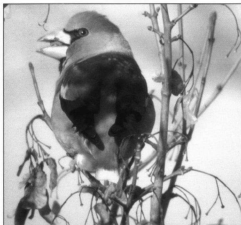
Appelvink, 9 januari 2003, Lauwersoog.

Volgens de Atlas van de Nederlandse Broedvogels is de Appelvink Coccothraustes coccothraustes in Nederland een schaarse broedvogel met naar schatting 8.000-10.000 paren (Bijlsma 2002). Volgens diezelfde atlas is het hok met Ter Apel het beste van de provincie Groningen met tussen de 26 en 100 paren. Andere goede hokken liggen noordelijker in Westerwolde en verder rond de dorpen Haren en Glimmen plus de zuidelijke helft van de stad Groningen. Recent broeden ook vogels in de bossen rond het Nieuwe Robbengat in de Lauwersmeer. Naar schatting broeden er in Groningen tussen de 100 en 200 paren.