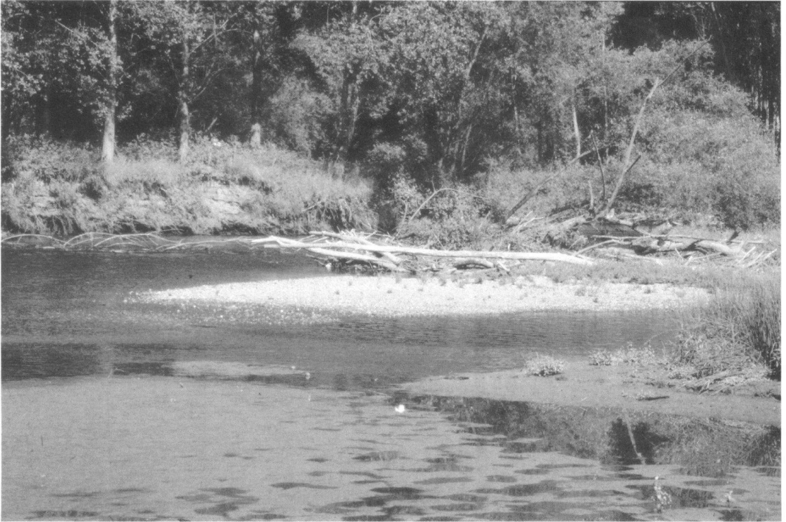
Figuur 2. Vindplaats van de Gaffellibel nabij de Duitse grens bij Vlodrop.