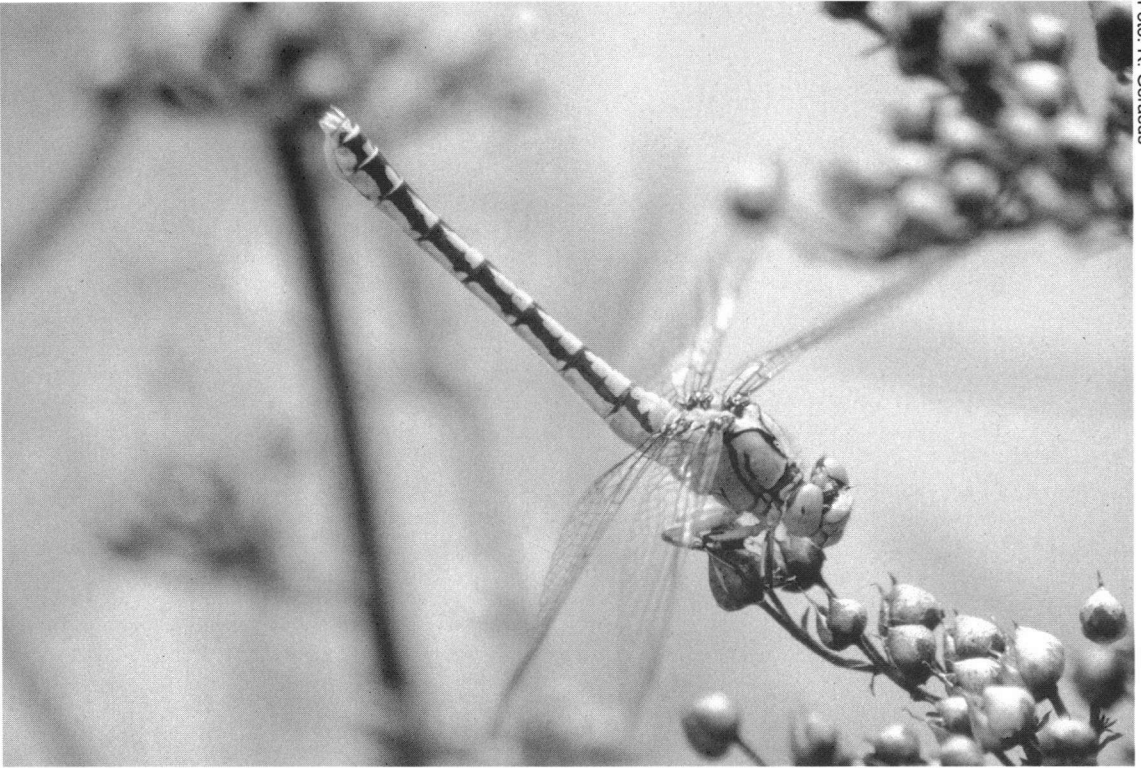
Figuur 3. Gaffellibbel vrouwtje die bezig is met het uitpersen van een eibal die vervolgens in de Roer is afgezet.