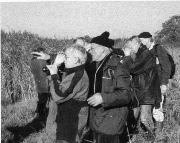
FFF-ers spotten Klapekster

De Fryske Feriening foar Fjildbiology deed overigens goede zaken, want een vijftal niet-leden die mee waren met de excursie werden lid.