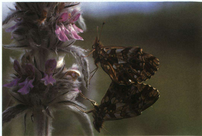
Akkerparelmoervlinder op andoorn.

enorm bloemrijk en er is beschutting van de struiken. Ontelbare heideblauwtjes zijn er het hele seizoen actief. Een soort die daar qua formaat nogal bij afsteekt is de grote en donkere blauwoogvlinder. Met name de vrouwtjes zijn opgesmukt met grote zilverblauwe ogen op de voorvleugels. Ook komen er veel soorten parelmoervlinders voor, die niet altijd even gemakkelijk zijn te determineren. Oostelijke, steppe- en bosparelmoervlinder zijn altijd lastig en pas na vele vangsten lukt het me om de toortsparelmoervlinder van de tweekleurige parelmoervlinder te onderscheiden. Dichter bij de bosrand leeft op een aantal locaties een populatie van de sleutelbloemvlinder. Deze soort heeft mij om verschillende redenen verrast. Ten eerste vliegt hij hier vrij laat (begin juni). Ten tweede groeit er in de omgeving geen enkele sleutelbloem. Bjorn Dal noemt in zijn gidsje van Midden-Europa de bosanemoon als mogelijke waardplant. Ik heb helaas nog geen vrouwtjes eitjes af zien zetten. Het zal dus nog wel even een raadsel blijven.