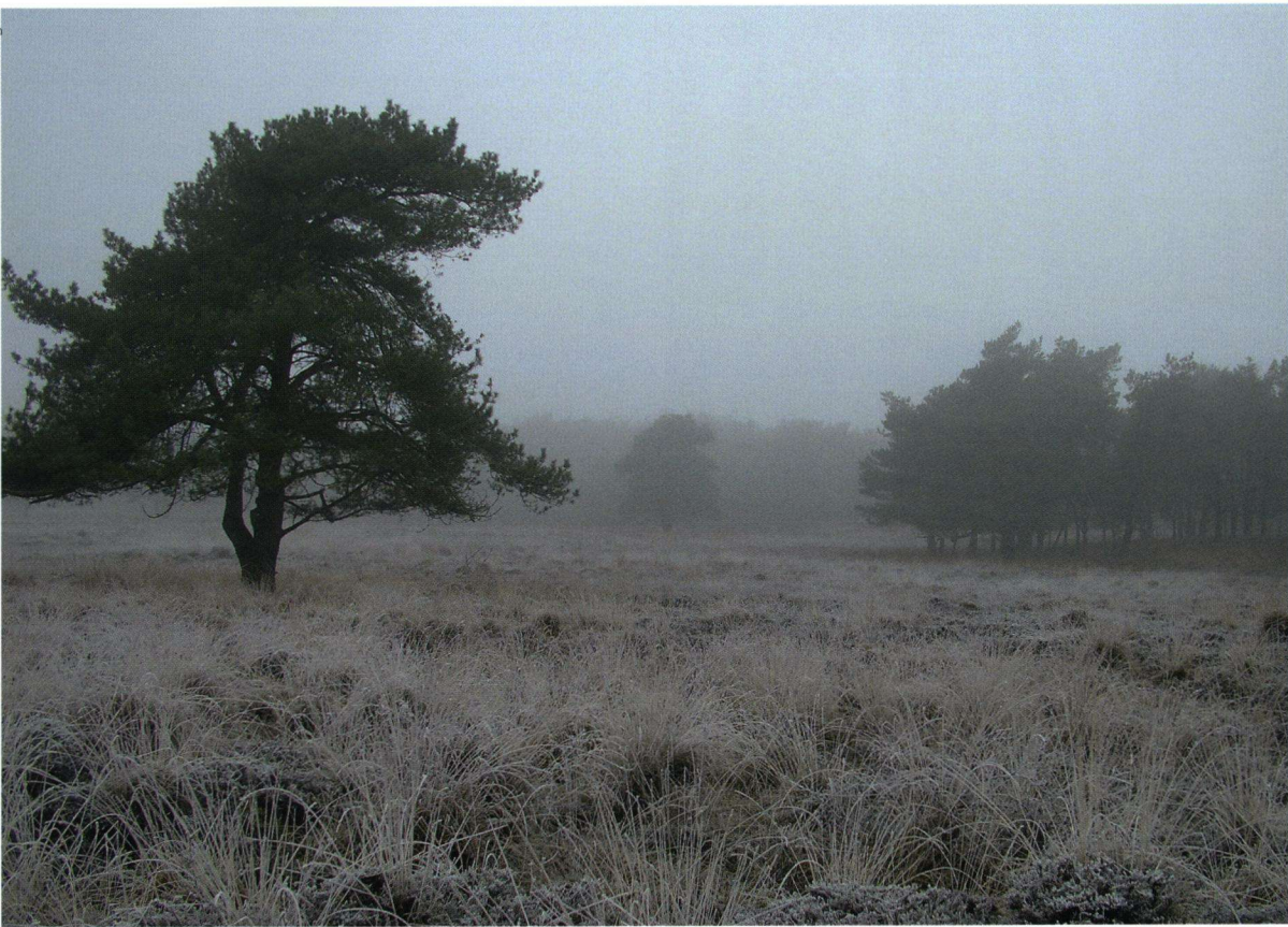
Onderzoeksgedeelte van de overwinteringsbiotoop van de noordse winterjuffer op het Uffelter Binnenveld.

daarmee de toekomst van deze bedreigde libellensoort in Nederland veilig te stellen.