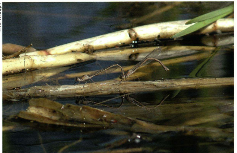
Voortplanting in april/mei in geschikte laagveenbiotopen, meestal op oude delen van lisdodde of riet.

Het is gebleken dat noordse winterjuffers grote afstanden kunnen afleggen. Het bewijs daarvan was een spectaculaire terugvangst begin november 2004 van twee gemerkte exemplaren noordse winterjuffers op het Uffelter Binnenveld. Deze bleken afkomstig uit de 20 km verder gelegen Lindevallei in Friesland. Deze dieren waren begin oktober door leden van de Friese libel-