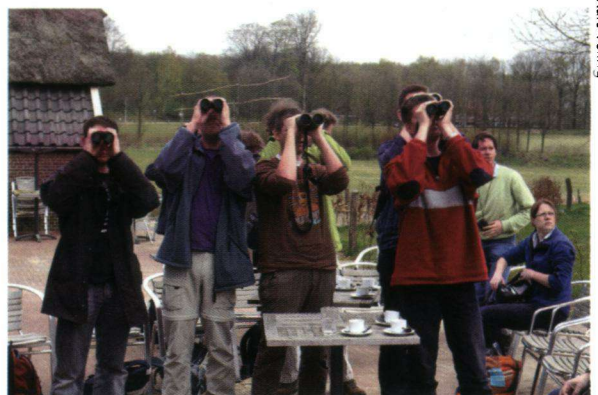
Waarnemers blijven eigenaar van hun waarnemingen.

De gegevens in de NDFF vertegenwoordigen een flinke waarde, omdat zij belangrijke informatie over de verspreiding van soorten bevatten. Die gegevens worden niet verhandeld of verkocht. De gegevens blijven altijd eigendom van de waarnemer of de organisatie die ze geleverd heeft. Hoe worden de NDFF en de mensen die de databank en de portalen beheren dan betaald? Het hele systeem draait op de gedachte dat niet voor de gegevens zelf, maar voor het gebruik (opslag en beheer) wordt betaald. De kosten worden verrekend via een abonnement of een losse levering. Dat is veel meer dan alleen een woordspel. Door voor het gebruik van de gegevens een vergoeding te vragen zijn klanten, wanneer ze een vraag aan de NDFF stellen, bijvoorbeeld altijd verzekerd van de meest recente gegevens. Het gebruik wordt geregeld via voorwaarden. Er is nog intensief overleg om die voorwaarden duidelijk op papier te krijgen. Betaalde abonnementen en betalingen voor losse leveringen zijn dus nodig om het geheel te financieren. Het Ministerie van LNV heeft namelijk wel de ontwikkeling gefinancierd, maar vindt dat het systeem zichzelf financieel moet kunnen bedruipen. Wat daarbij voorop staat is dat er geen commerciële doelen worden nagestreefd,