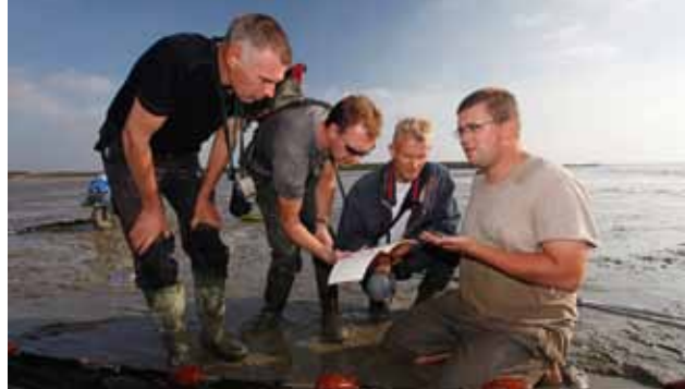
Vissenweekend 2014 Zeeland

In RAVON 51 (dec 2013) hebben we aangekondigd dat het waarnemingenoverzicht 2013 niet meer in het tijdschrift zal verschijnen. Het zal binnenkort digitaal beschikbaar zijn op www.ravon.nl . Het overzicht omvat heel 2013, een jaar waarin dankzij velen weer veel nieuwe waarnemingen aan het databestand zijn toegevoegd. De resultaten zijn net als voorgaande jaren weergegeven in de vorm van kaarten per soort. Per soortgroep wordt een korte toelichting op deze kaarten gegeven.