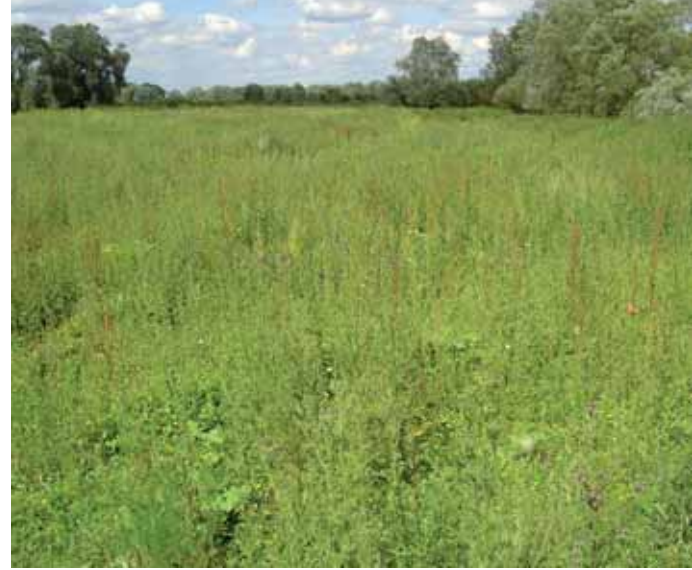
Foto 6. Na ruim 15 jaar natuurontwikkeling op Koningssteen langs de Limburgse Grensmaas zijn onder invloed van extensieve begrazing soortenrijke struwelen ontstaan met flinke populaties van onder andere Grasmus.

de monding van de IJssel. Voor de ontwikkeling van hardhoutoobossen en oude zachthoutoobossen is gezien de gewenste doorstroomcapaciteit veel ruimte nodig, wat alleen te realiseren is op relatief brede riviertrajecten, al dan niet na dijkteruglegging.