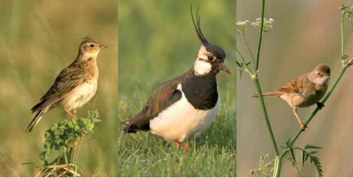
Foto 2. De Veldleeuwerik neemt sterk in aantal af in reguliere uiterwaarden, maar neemt toe in natuurontwikkelingsgebieden.