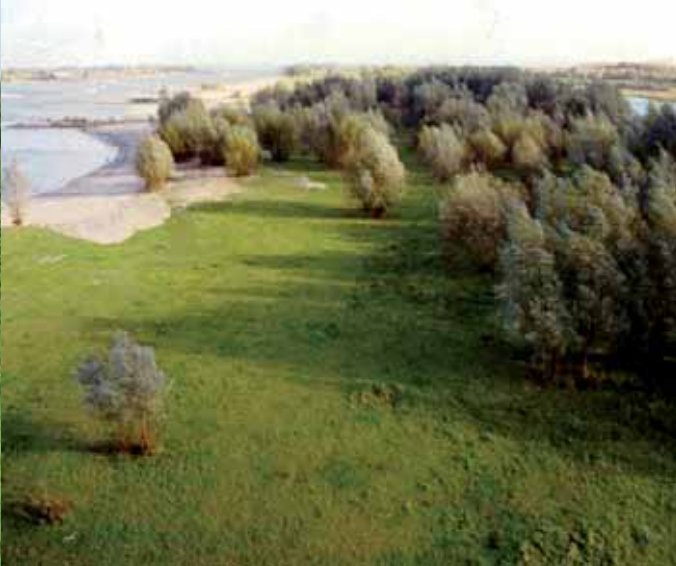
Foto 7. Ontwikkeling van zacht-houtoibos op de Ewijkse Plaats.

Faunawerkgroep Gelderse Poort, 2002. Vogels in de Gelderse Poort, deel 1: broedvogels 1960-2000. Vogelwerkgroep Rijk van Nijmegen e.o., Kartiergemeenschap Salmorth, Vogelwerkgroep Arnhem e.o., NABU Kranenburg, Naturschutzstation im Kreis Kleve e.V., Provincie Gelderland, SOVON Vogelonderzoek Nederland.