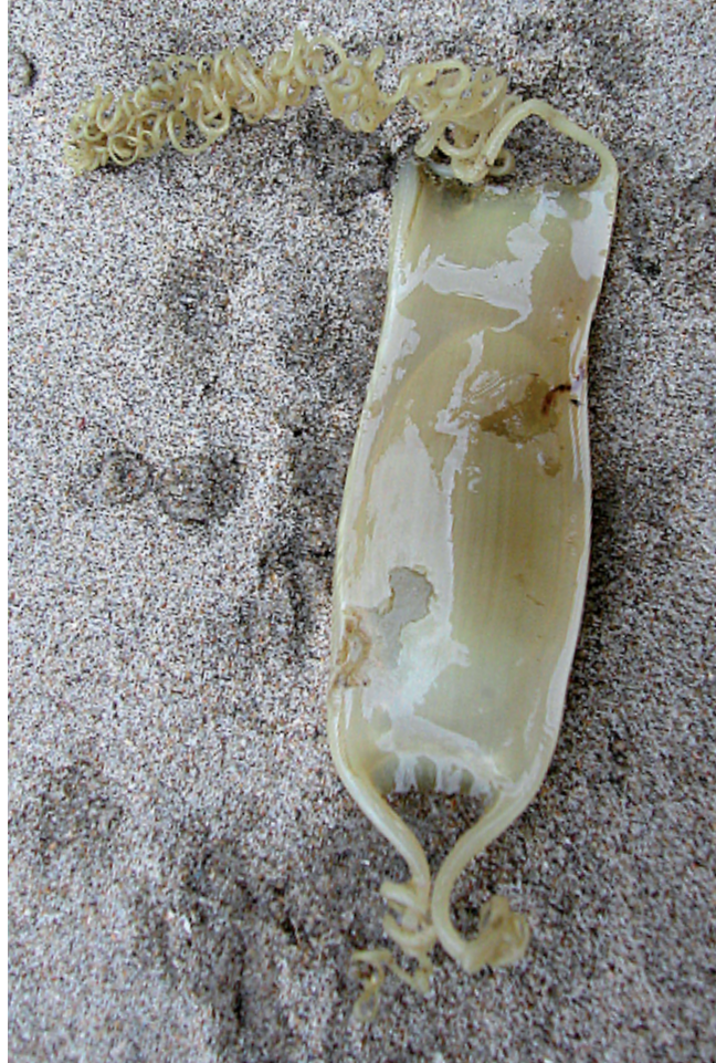
Eikapsels van de Hondshaai ( Scyliorhinus canicula ) worden gekenmerkt door de geelbruine kleur en de draadachtige gekrulde hoorns aan de hoeken van het eikapsel. Eikapsels van roggen zijn donkerbruin tot zwart van kleur. De hoorns zijn vrij stijf en zijn niet gekruld.

Voor zeven van de elf roggensoorten geldt dat er voldoende waarnemingen zijn van eikapsels om een statistische analyse te kunnen uitvoeren op de waarnemingsgegevens. Uit de analyse blijkt dat van zes van de zeven roggensoorten het aantal aangespoelde eikapsels zeer sterk is afgenomen (Gmelig Meyling, 2009). Voor de Grootoogrog ( Raja naevus ), de Blonde rog ( Raja brachyura ), de Kleinoogrog ( Raja micoocellata ) en de Gevlekte rog ( Raja montagui ) geldt dat eikapsels na 1965 nauwelijks nog zijn aangetroffen, terwijl die voordien geregeld werden gevonden (fig. 1). Eikapsels van de Vleet ( Raja batis ) waren vóór 1962 al vrij zeldzaam, maar nadien is er geen één op onze stranden meer waargenomen (fig. 2). Vóór 1970 werd de Vleet geregeld gevangen in het Nederlandse deel van de Noordzee, maar na 1970 zijn daar nog slechts enkele Vleten waargenomen (Heessen & Ellis, dit nummer). Eikapsels van de