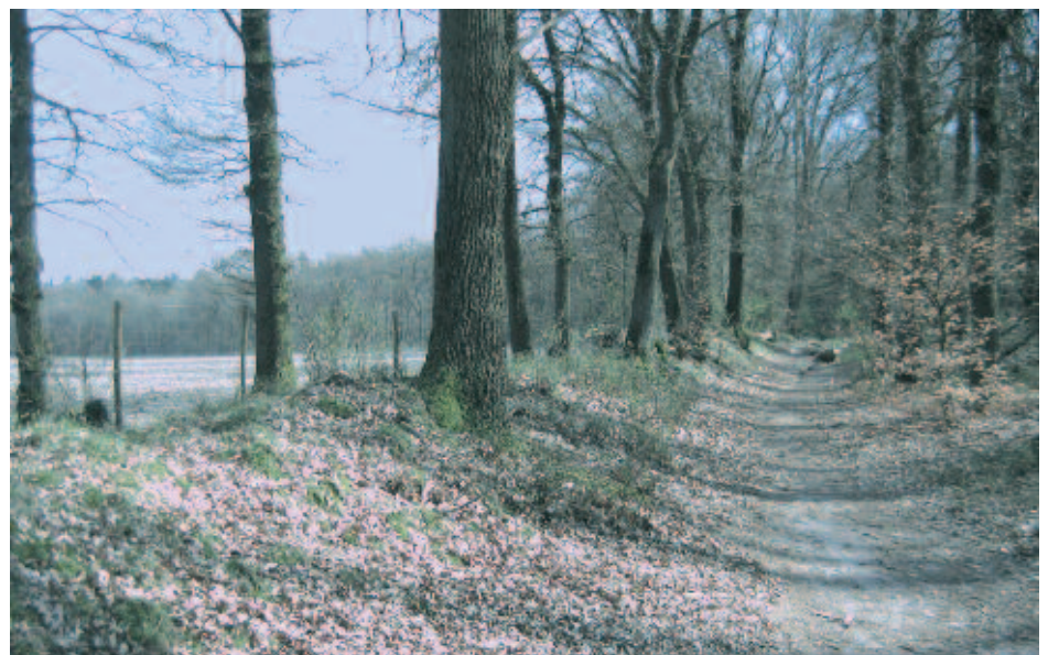
Wal in Van der Huchtbos.

Ir. M. Boosten & Ing. M.H.A. van Benthem Stichting Probos Postbus 253, 6700 AG Wageningen martijn.boosten@probos.nl mark.vanbenthem@probos.nl