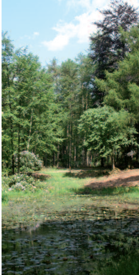
Vrijgestelde leemkuil in Tongeren.

De provincie Gelderland wil de rijke cultuurhistorie van de Veluwse bossen voor het voetlicht brengen. Dit doet zij door het stimuleren van uitvoeringsprojecten waarbij historische elementen of structuren in het bos worden behouden, geaccentueerd, gerestaureerd of gereconstrueerd, of waarbij op een andere wijze de historie van het bosgebied tastbaar en beleefbaar wordt