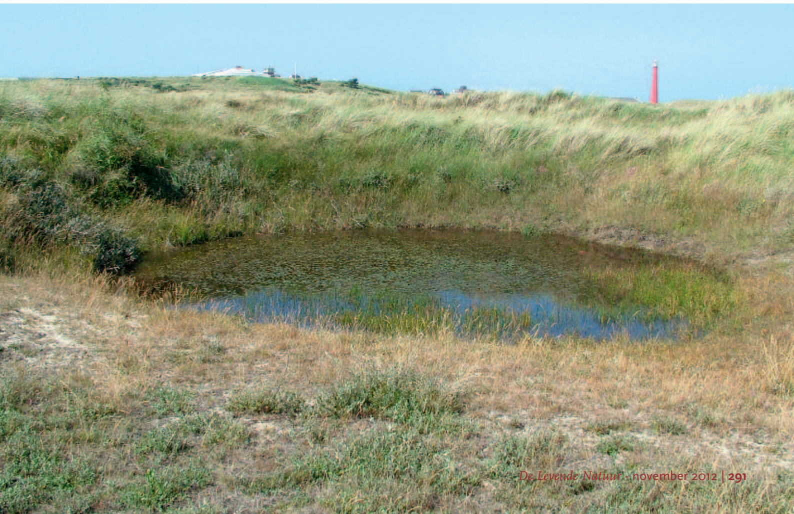
Foto 3. Een kleine permanente plas in de Grafelijkheidsduinen bij Den Helder, ongeveer 70 jaar geleden ontstaan als bomkrater. Zulke diepe poelen met alleen een ijle begroeiing zijn een geschikte permanente woonplaats voor libellen.

R. Manger Stoepveldsingel 55, 9403 SM Assen rene@mangereco.nl