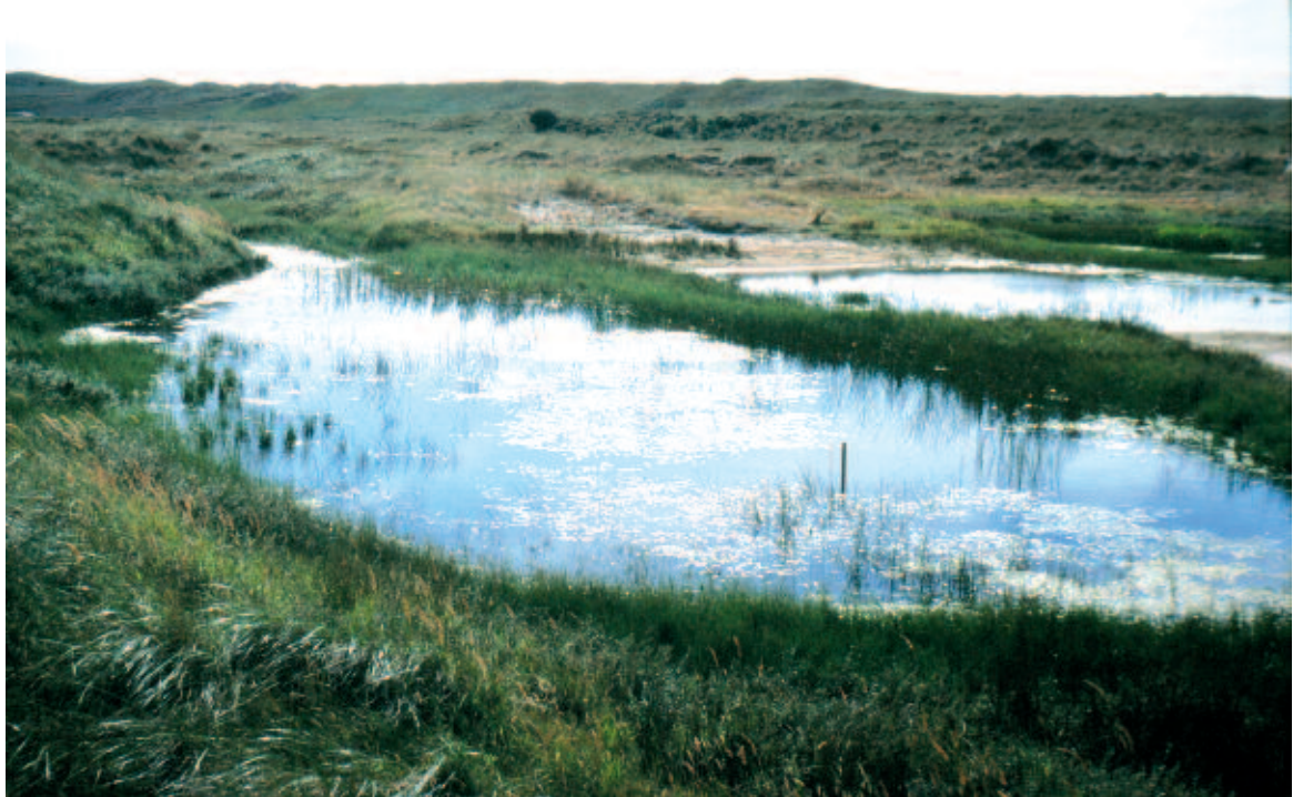
Foto 2. De Kijkduinvijver in de Grafelijkheidsduinen bij Den Helder vóór eind-2005, toen het achterste (ondiepste) deel werd uitgediept. Dit deel van de plas valt nu nooit meer droog en is nu voortdurend rijk bevolkt met libellen.

meteen verjaagd. Hierdoor verdelen de individuen van grote libellensoorten zich snel over het hele gebied en worden alle geschikte plekken bezet. In Engeland nam Moore (1991) waar, dat nieuw-gegraven poelen en plassen al heel snel na hun ontstaan bevolkt werden door één of enkele exemplaren van zulke territoriale soorten. In het Zwanewater konden we dit verschil in het tempo van herbevolking tussen juffertjes en grote libellen bevestigen, toen daar in 2009 een deel van de poelen droogviel. Bij enkele van de in 2009 drooggevallen poeltjes verschenen in 2010 zelfs in het geheel geen juffertjes en bleef het totale soortenaantal dus ook laag. Lage grondwaterstanden veroorzaken dus volledig verdwijnen van alle soorten libellen overal waar open water volledig verdwijnt. Een jaar later is de 'ramp' nog zichtbaar aan de aantallen soorten en vooral aan het aantal individuen van de juffertjes. Die bleken wel twee jaar nodig te hebben voor volledig herstel van hun populaties.