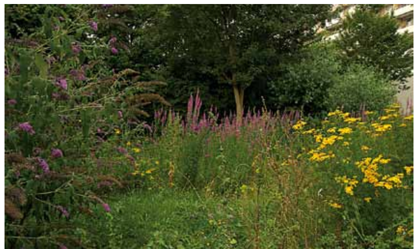
Onze boerenlandvlinders moeten het tegenwoordig hebben van parken en bermen in de stad.

Met steun van de Postcodeloterij gaat De Vlinderstichting de komende drie jaar heel veel bloemrijke gebieden – idylles – aanleggen. Voor mensen om van te genieten en voor vlinders en bijen om beter te kunnen overleven. De graslandvlinders zullen hier zeker baat bij hebben!