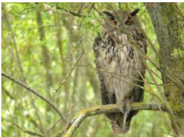
Oehoe bij de Proefboerderij, 6 juni 2010

In november 2009 ontsnapte er een Oehoe uit de voliëre van Pim Lollinga in Westernieland. De vogel had een roze ring en een leertje en was als zodanig goed herkenbaar. Het was een vrouwtje van zes maanden oud en ze was vrij grijzig van kleur (zie foto's van Rommert Cazemier op www.lauwersmeer.com en de foto hieronder). Na wat omzwervingen kwam dit exemplaar in het Lauwersmeergebied terecht en was regelmatig te zien langs de Hooge Zuidwal.