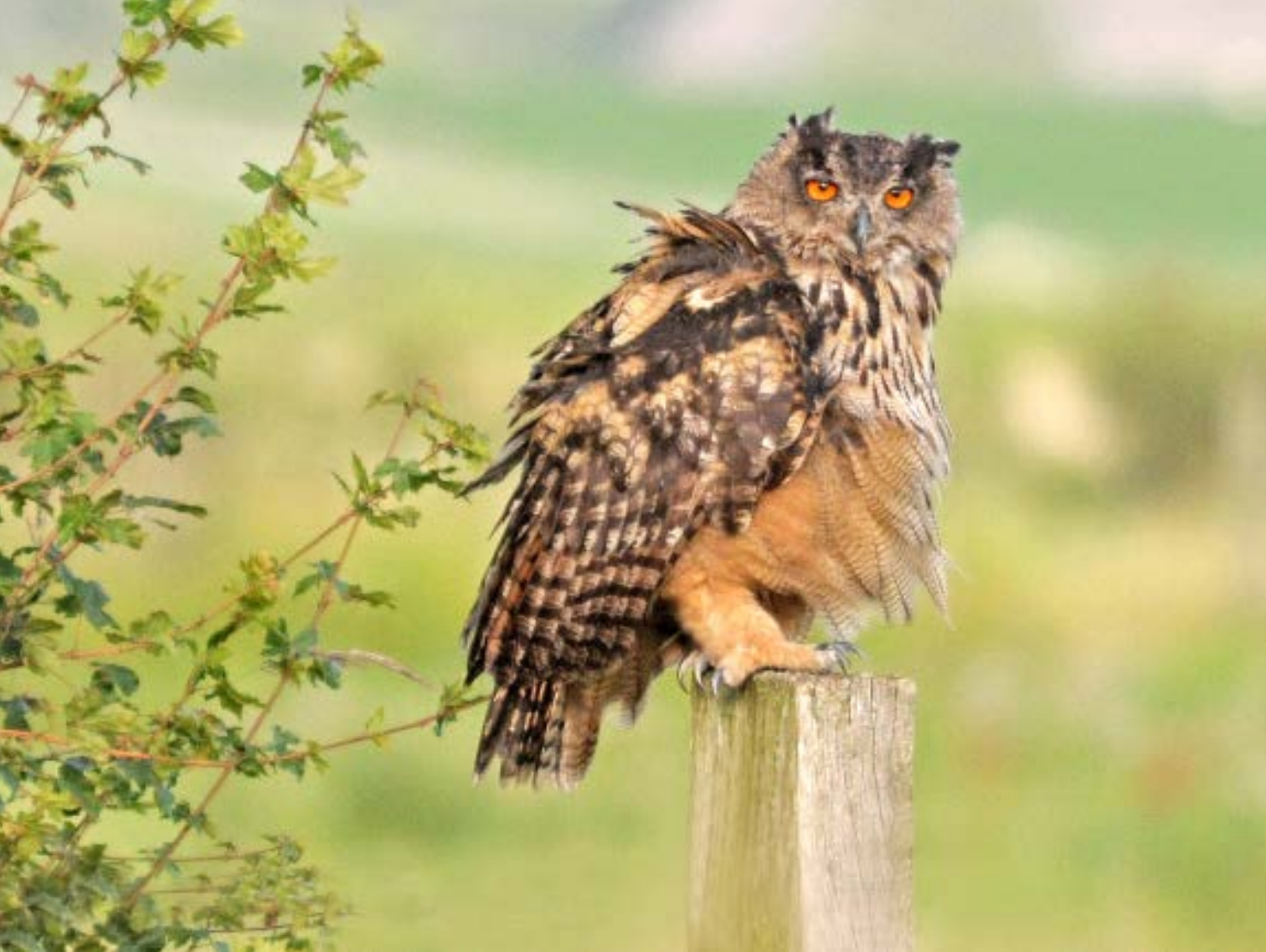
Oehoe in de Lauwersmeer bij de kazerne 10 augustus 2013