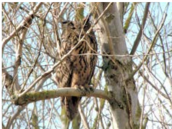
Oehoe Lauwersmeer 28 apr. 2013

De laatste waarneming daar is van Marchel Stienstra die op 14 juni 's avonds om 22:30 uur een Oehoe op een akker zag bij de kruifabriek.