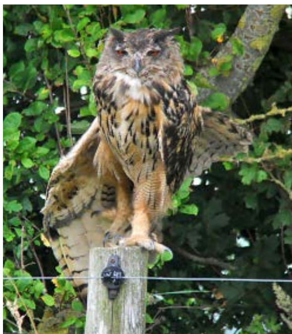
De vogel bij de kazerne 7 aug. 2013

Er is zelfs nog een vijfde exemplaar aanwezig. Deze was vanaf augustus aanwezig in de omgeving van de kazerne nabij het Jaap Deensgat en deze vogel kwam uitgebreid in de media. Deze vogel is ongeringd en vertoont ook geen sporen van gevangenschap. De vogel heeft handpen 9 en 10 geruid en is daarom iets ouder dan drie jaar. Het gaat hier dus om een ander exemplaar dan de Oehoe bij Zoutkamp.