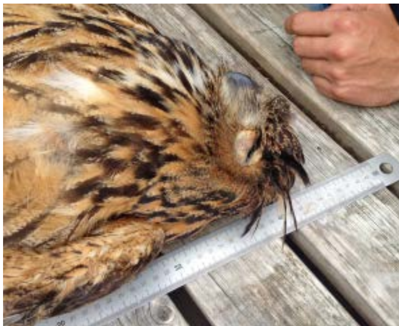
Dode Oehoe, gevonden aan de Stadsweg te Lauwerszijk juni 2013

Op grond van de leeftijd is het zeer waarschijnlijk dat de vogel van Zoutkamp, die enige tijd in het vogelasiel te Meedhuizen is opgevangen, en deze dood gevonden vogel dezelfde vogel is.