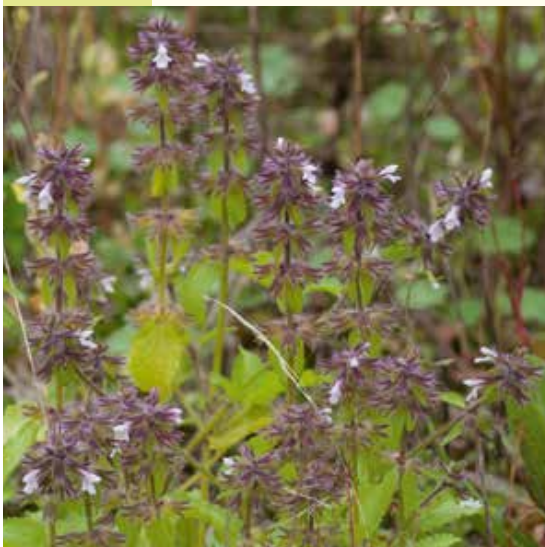
Akkerandoorn (foto links: Eric Slootweg, foto rechts: Valentine Kalwij).

De huidige vindplaatsen van Akkerandoorn in Noord-Drenthe