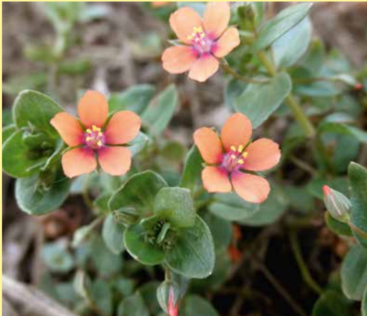
Rood guichelheil (foto: Bert Verbruggen).

komen goed overeen met wat hier vijftien jaar geleden over is geschreven in de Atlas van de Drentse Flora: 'Het voorkomen van Akkerandoorn in Drenthe is vrijwel beperkt tot tuinen en ruderaal terreintjes. In akkers komt ze nauwelijks voor.'