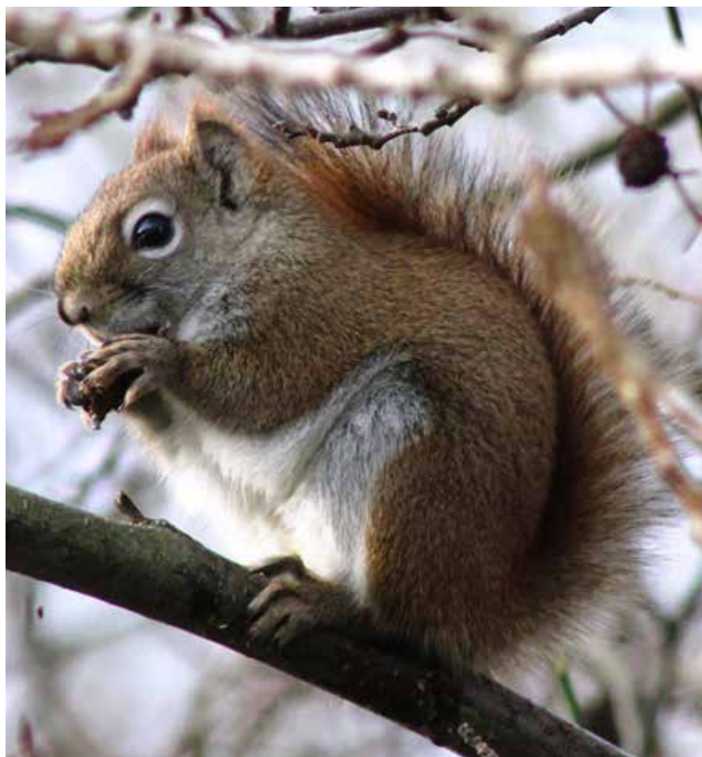
Amerikaanse rode eekhoorn.