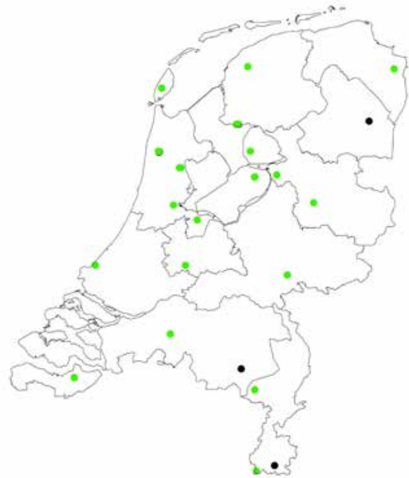
Figuur 2. Het aantal meldingen en exemplaren van de Amerikaanse rode eekhoorn ( Tamiasciurus hudsonicus ) in Nederland in de periode 2007 – 16 januari 2014

Figuur 1. Locaties van meldingen van Amerikaanse rode eekhoorn ( Tamiasciurus hudsonicus ) in Nederland, in de periode 2007 – 16 januari 2014 (groen; gevalideerde waarnemingen, zwart; ongevalideerde waarnemingen).