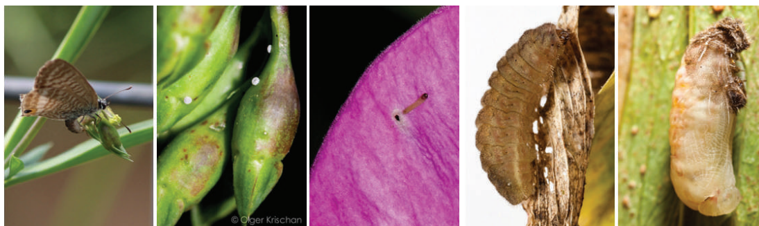
Tijgerblauwtje stadia: ei-afzet - eitjes - jong rups - oude rups en pop.

Tijgerblauwtjes komen voor in Midden- en Zuid-Europa en Noord-Afrika en kunnen grote afstanden afleggen. Eerdere jaren leek het erop dat ze alleen als verstekeling met peultjes uit zuidelijke landen meekwamen; toen waren er ook diverse meldingen uit supermarkten en keukens. Maar nu heeft De Vlinderstichting reden om aan te nemen dat de tijgerblauwtjes op eigen kracht onze kant op zijn gekomen. De zomer van 2015 kende een aantal warmtegolven, met luchtstromingen vanuit het zuiden, die de tijgerblauwtjes waarschijnlijk in ons land hebben gebracht. Er zijn dit jaar van meer dan 20 locaties meldingen van de vlinder, voornamelijk uit het zuiden van ons land (zie kaartje). Het zou goed kunnen zijn dat door de verandering van het klimaat het tijgerblauwtje een jaarlijks terugkerende trekvlinder wordt, zoals bijvoorbeeld oranje luzernevlinder en kolibrievlinder. Het is een vlinder die hier normaal gesproken de winter niet kan overleven.