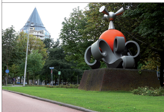
▲ (Boven, midden) Gedraaid knikmos ( Bryum capillare ) op Lof der Zotheid, monument voor een ezel. (Onder) Eerdergenoemd kunstwerk.