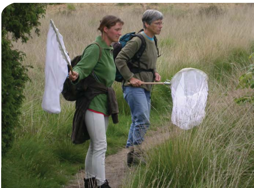
De KNNV in actie, op zoek naar libellen!

Poot, R.J., 1995. De adoptie van het Hondenven. Natura 92e jaargang, no. 8, oktober 1995, pag. 180-181