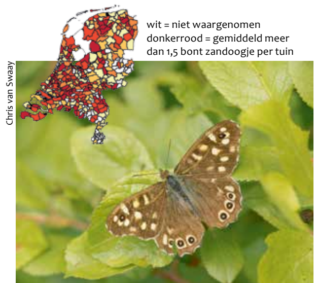
Het bont zandoojje wordt steeds meer in tuinen gezien.