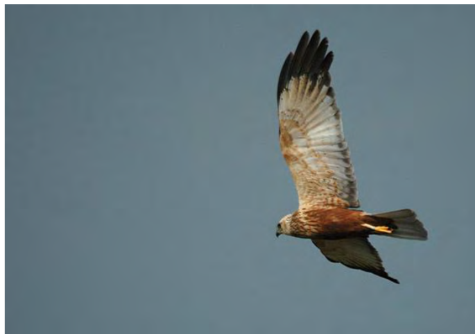
Bruine Kiekendief (man).

Tijdens de zeetrek wil er ook wel eens een roofvogel langs komen. Oostenwind is daar goed voor. Zo komt er in de meeste jaren in dit kwartaal nog wel een late Blauwe Kiekendief langs. Dit jaar helaas niet, wat jammer is omdat we anders alle soorten kiekendieven die in Nederland voorkomen hadden kunnen noteren.