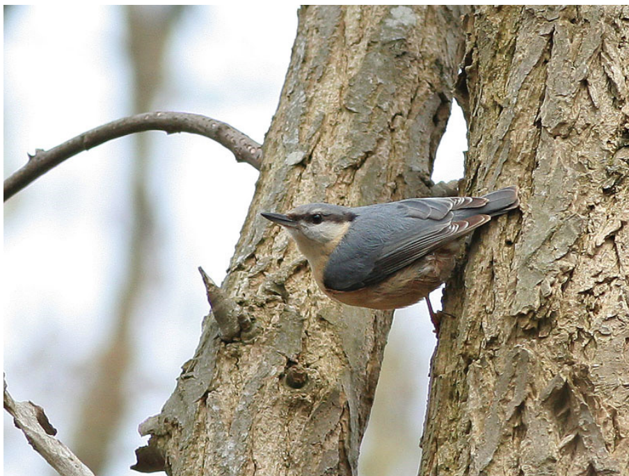
Boomklever in Nieuw-Leeuwenhorst

noteren. Op het formulier staan ook de vroegste aankomst ooit, de gemiddelde aankomst over de afgelopen 20 jaar en de eerste datum van vorig jaar. Nu zal het niet meevallen om dat eerste rijtje met de allervroegste aankomsten te verbeteren. Wat wel leuk is om met deze lijst het voorjaar te volgen. De soorten staan namelijk in de volgorde waarin ze (in een gemiddeld jaar) aankomen. Als je dus eenmaal een Fitis hebt gehoord, dan weet je dat het tijd is om uit te gaan kijken naar de eerste Boerenzwaluw. Hoewel die natuurlijk ook best vroeger kan zijn dan de Fitis. Degenen die dit lijstje bijhouden kunnen deze aan het eind van het seizoen sturen naar mijn adres (zie formulier). Maar u kunt natuurlijk ook gewoon uw waarneming op www.waarneming.nl zetten, dan komen ze vanzelf bij mij terecht.