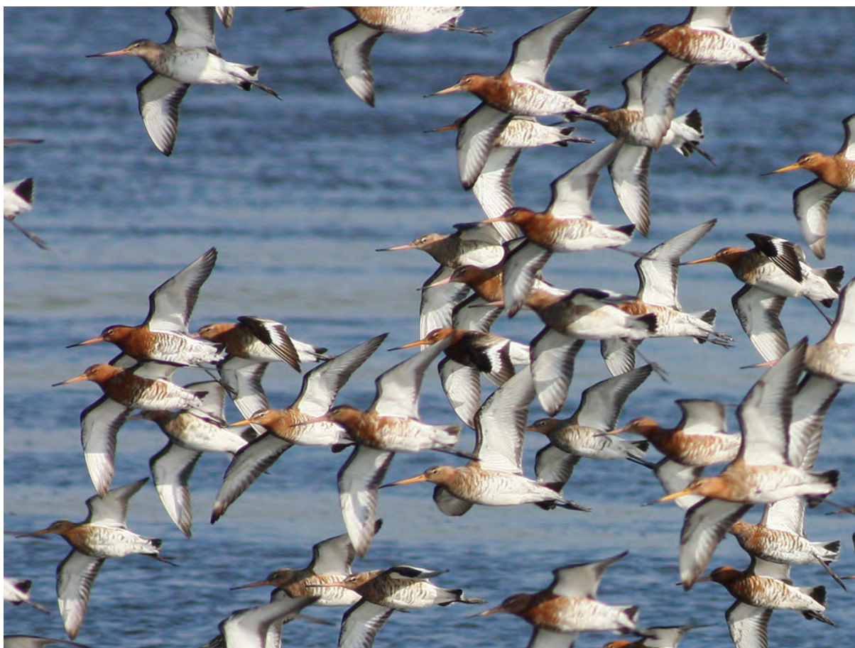
IJslanse Grutto's bij het Landje van Geijsel bij Ouderkerk a/d Amstel.