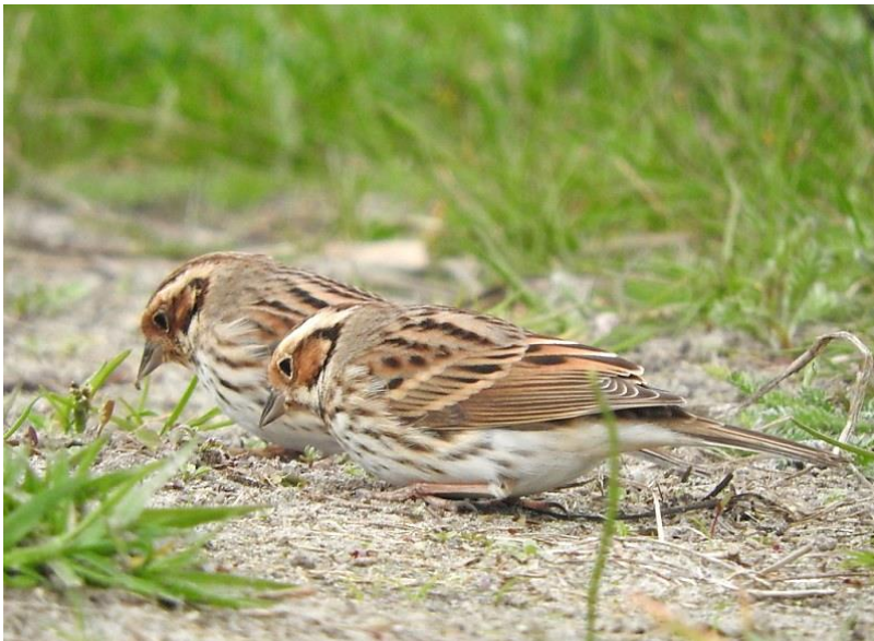
Dwerggors – 1 mei 2017 Noordwijk - Achterweg

Na een zachte maartmaand volgde een koude april. De eerste tien dagen lagen de temperaturen met een zuidelijke stroming nog boven normaal. Daarna bepaalden storingen en lagedrukgebieden het weer. De wind zat veel in het noorden, waarmee koude lucht werd aangevoerd en het vaak stevig waaide. Het was daarbij zonnig en er viel weinig neerslag.