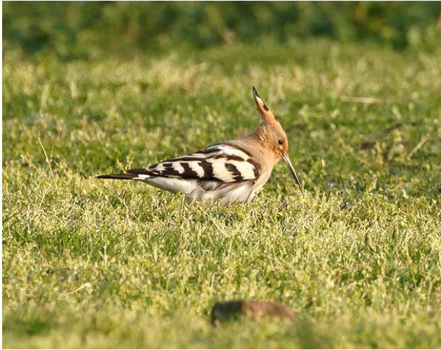
Hop – 6 mei Coepelduynen

Het droge weer zette zich voort in mei. De maand begon somber en koel. Daarna werd het onder invloed van een hogedrukgebied warmer. Met een heldere nacht en aanvoer van koude polaire wind ging op 9 mei de temperatuur nog richting het vriespunt. De tweede helft van de maand bracht een zuidelijke stroming warme lucht en de maand eindigde met extreem warm weer met zomerse temperaturen.