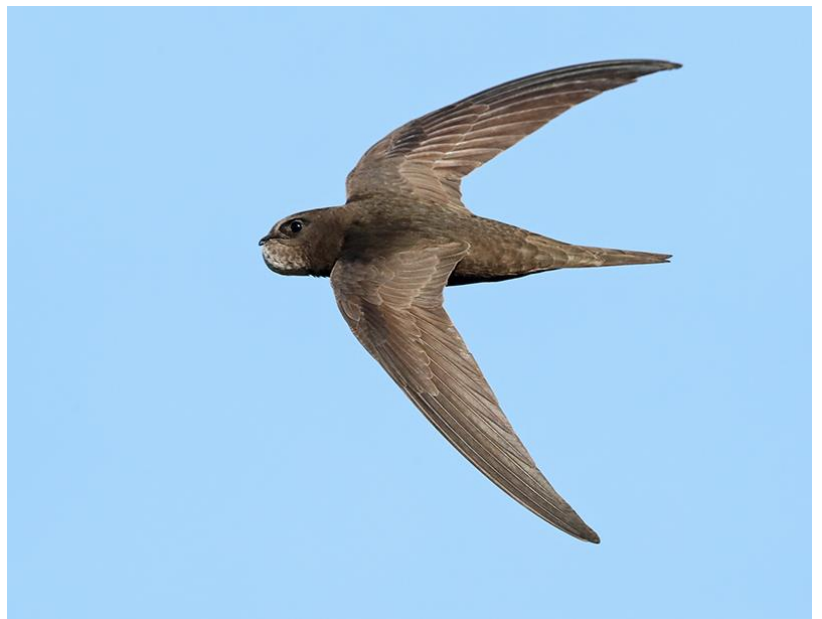
Gierzwaluw met een volle krop voer voor de jongen.