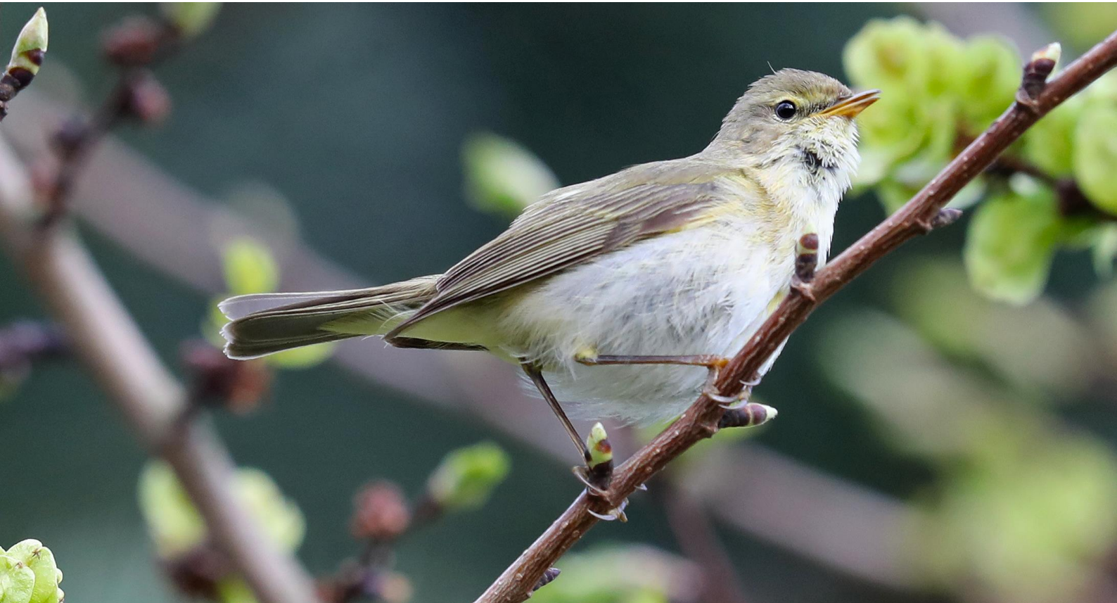
Iberische Tjiftjaf

De Iberische Tjiftjaf is ook niet zomaar een Tjiftjaf met een afwijkende zang. Degenen die de vogel goed bekeken hebben zullen hebben gezien dat het echt een andere vogel is: langgerechter door langere snavel en vleugel en helderwit van onder als een Fitis. Een aparte soort, ook in zijn habitat en gedrag. Is de Tjiftjaf een generalist die in veel habitats voorkomt, de Iberische Tjiftjaf is veel meer een specialist van gematigd loofhout, vaak op hellingen. Het kerngebied is het NW Iberisch schiereiland. Een verschil is ook dat de Iberische Tjiftjaf een lange afstand trekker is die in een relatief klein gebied in W Afrika overwintert. Hij heeft de lange vleugels niet voor niets. Als in Spanje onze Tjiftjaffen arriveren om te overwinteren, dan is de Iberische Tjiftjaf al vertrokken. Zelf ken ik ze ook uit hun overwinteringsgebied in W Afrika. Je associeert een Tjiftjaf met een korte afstandstrekker en het was een verrassing te zien dat in het gebied in Z Mali waar ik zat ze talrijker waren dan de Fitis, een bekende Afrikaganger. In het voorjaar schieten soms Iberische Tjiftjaffen door en duiken dan in ons land op. De laatste jaren wordt er jaarlijks wel ergens een vogel ontdekt, vaak in de kuststreek. De Noordwijkse vogel was met 9 april één van de vroegste ooit, de tweede na een Friese vogel op 8 april in 2002.