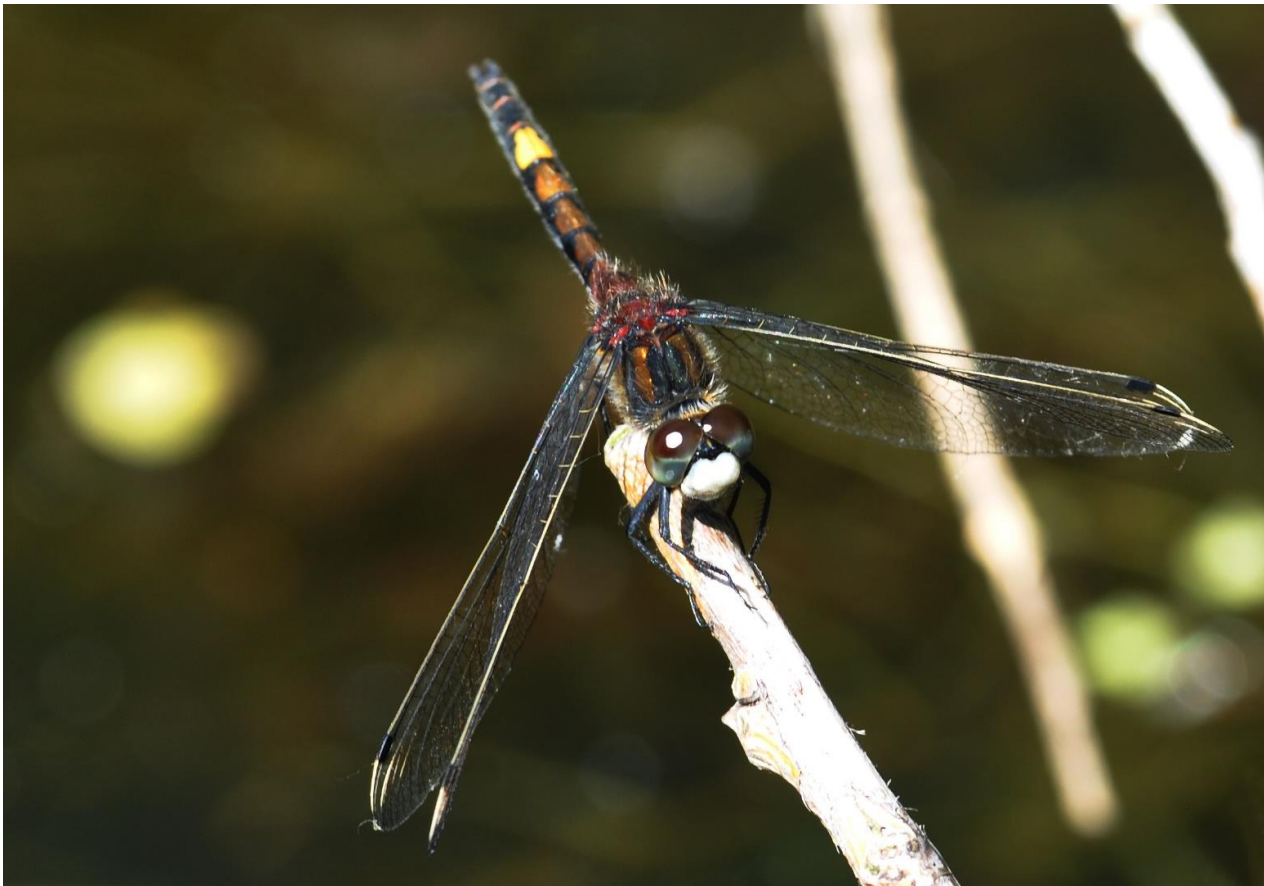
Gevlekte witsnuitlibel – 28 mei 2017 Noordwijk - Willem v.d. Bergh (Stichting)