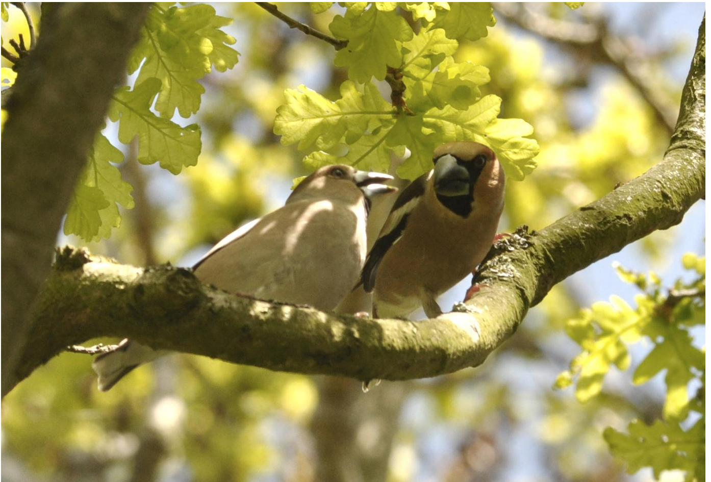
Appelvink 6 mei 2017 Noordwijkerhout - Klein-Leeuwenhorst