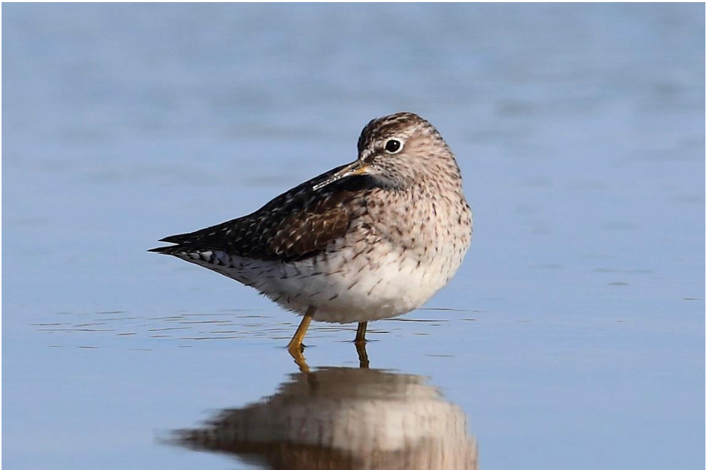
Bosruiter – 30 april 2017 Amsterdamse Waterleidingduinen - Weitje van de Blauwe Paal

het Langeveld (RG). In de Van Limburg Stirumvallei in de AWD streken op 18 april 3 Morinelplevieren neer (WB JV). Op 21 april vloog een Rode Wouw over de AWD (JW). De laatste twee dagen van de maanden leverden aardige roofvogeltrek, met minimaal 7 Bruine Kiekendieven op 30 april (CZ ea) en op beide dagen een Visarend (PS CZ ea). Op 30 april vloog boven 's Gravendijk ook de eerste Boomvalk van het seizoen (CZ). Op 29 april vlogen 2 Kraanvogels over de Elsgeesterpolder (RG). In de laatste week van april was er veel doortrek van Tapuiten , met tot 8 vogels in de Elsgeesterpolder (JZ ea). Op 30 april zat er een Bonte Vliegenvanger in de AWD in het Achterhaasveld (RD). Op het Weitje van de Blauwe Paal was die dag een Bosruiter neergestreken (MK).