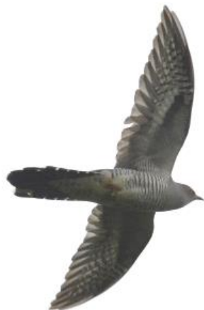
Koekoek 7 mei 2017 ©Casper Zuyderduyn Noordwijk (gemeente)

Op 16 april liep er een Wezel in De Blink (PS). Op 29 april vloog een Oranjetipje bij de Kraaierslaan in de Noordzijderpolder (JB).