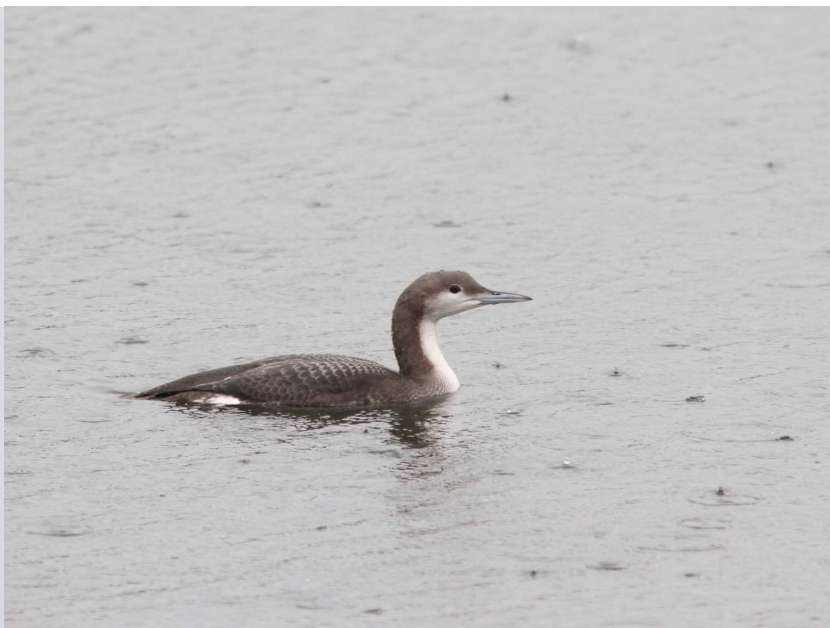
Parelduiker in de AWD in winterkleed