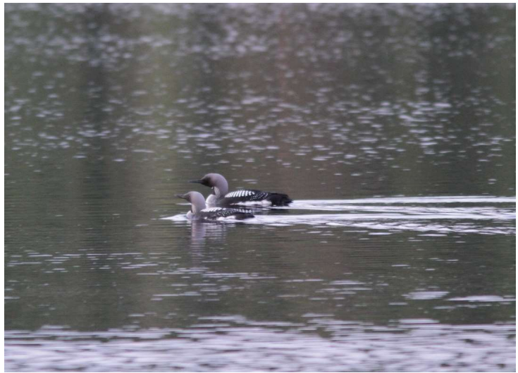
Paartje Parelduikers bij de camping in avondlicht

plek op de camping Grinsby hadden we een prachtig uitzicht op het meer en we konden de Parelduikers mooi heen en weer zien zwemmen. Parelduikers geven de voorkeur aan grote meren met een of meer eilandjes in het midden. Op deze eilandjes broeden ze en zitten ze veilig voor vossen en andere belagers.