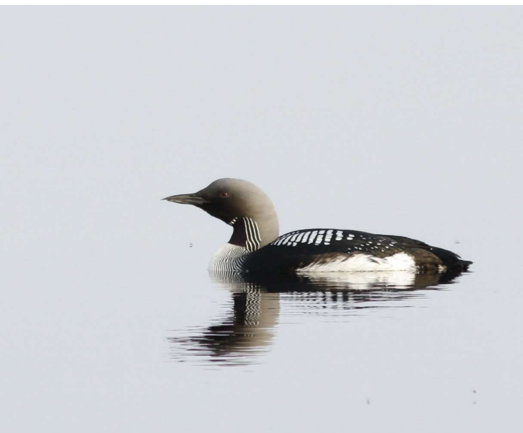
Parelduiker in zomerkleed

Al met al konden we naar de camping teruggaan met een aantal mooie foto's waarvan we hierbij enkele laten zien.