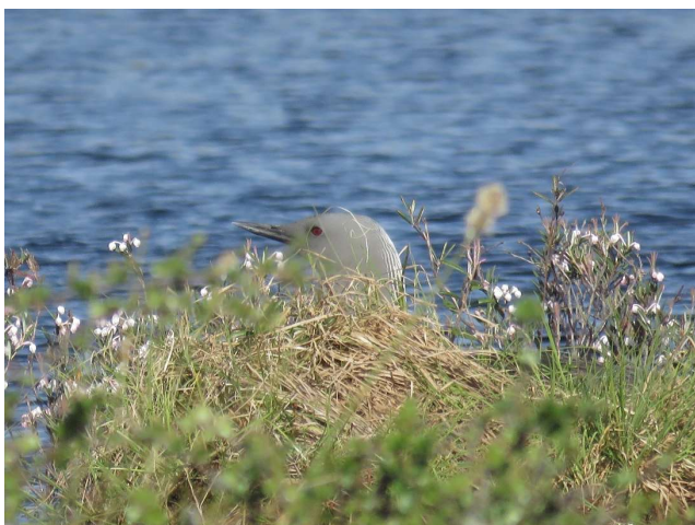
Vrouwte Roodkeelduiker op nest

horen. Alleen is hun galm iets minder melodieus dan bij Parelduikers. Opvallend is, dat Roodkeelduikers bij voorkeur 's morgens hun aanwezigheid laten horen, terwijl dat bij de Parelduikers 's avonds het geval is. Zij zwommen regelmatig heen en weer en op een gegeven moment stegen ze bijna uit het water om er een soort dans uit te voeren. Het was een indrukwekkend gezicht, dat we nog nooit hadden meegemaakt. Aan het einde van deze vertoning klom het vrouwtje op een grote graspol, waarop haar nest lag. Op de terugweg passeerden we een ander meertje en daar zaten nog enkele Roodkeelduikers. We vermoedden, dat hier een paar mannetjes om de gunst dongen van een begeerd vrouwtje.