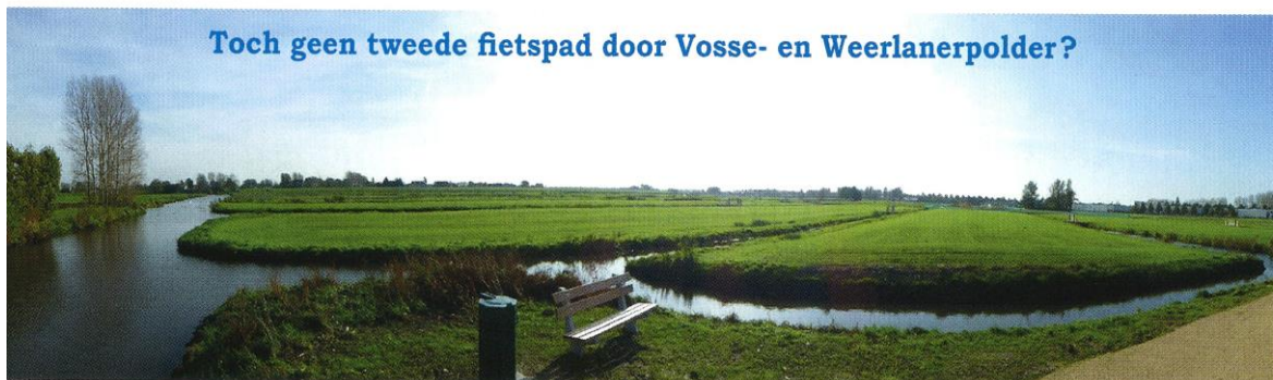
VOSSE- EN WEERLANERPOLDER na de herinrichting.

Sinds de recreatiepaden in de Vosse- en Weerlanerpolder zijn aangelegd en voor het publiek opengesteld is het aantal vogels er helaas aanmerkelijk teruggelopen. Alsof dat nog niet genoeg is, dreigt er echter nóg een pad dwars door het gebied te worden aangelegd en wel een provinciaal fietspad. Nog een fietspad met alle verstoring van dien is de doodsteek voor de weidevogels in dit relatief kleine gebied, riepen wij in onze contacten met de gemeente Hillegom al langer. Maar tot nu leek die oproep aan dovemansoren gericht. Al 20 jaar was aan dat plan gewerkt, werd ons verteld. Het bestemmingsplan is al jaren onherroepelijk, de onteigening voor de benodigde gronden is bijna afgerond en het geld is beschikbaar. Die trein kon niet meer worden stopgezet.