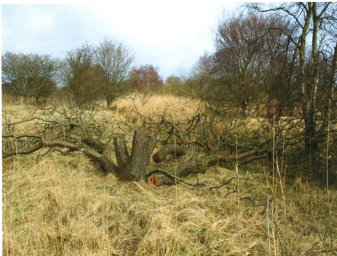
Zagen in de WATERLEIDINGDUINEN .

duin. En als dat incidenteel toch nodig zou zijn, zou in samenwerking met de vogelwerkgroep vooraf goed onderzoek worden gedaan naar broedvogels. Sinds dit jaar is Waternet echter ineens, zonder ruggespraak met ons, opnieuw begonnen met zaagwerkzaamheden door vrijwilligers. Waternet heeft hiervoor wel excuses aangeboden, maar stelt dat deze zaagwerkzaamheden noodzakelijk zijn voor het terugdringen van de Amerikaanse vogelkers. Ook stelt Waternet dat ze zich daarbij houden aan de gedragscode en conform de eisen vooraf onderzoek doen naar eventuele vogelnesten. Over de kwaliteit van dit onderzoek door vrijwilligers - voortsnog eveneens uitgevoerd zonder de beloofde ruggespraak met de vogelwerkgroep - hebben wij behoorlijke twijfels. Deze twijfels werden versterkt, toen we ontdekten dat zelfs in de beschermingszone van goed zichtbare