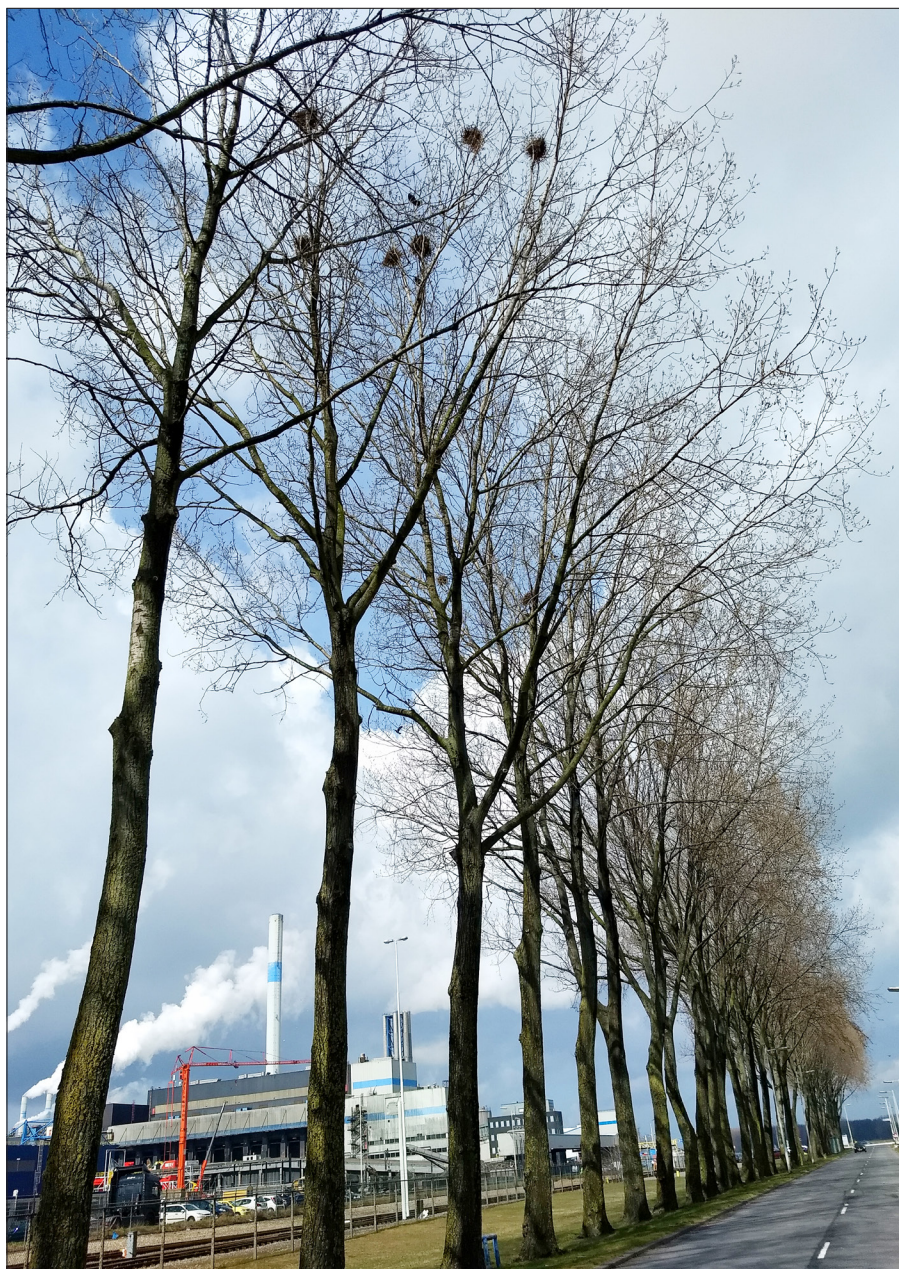
▲ De roekenkolonie op Rozenburg is vooral in het vroege voorjaar goed te zien. (Garry Bakker)