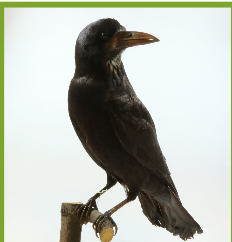
▲ De oudst bekende Rotterdamse roek staat in de collectie van Het Natuurhistorisch met collectienummer NMR 9989-0454.