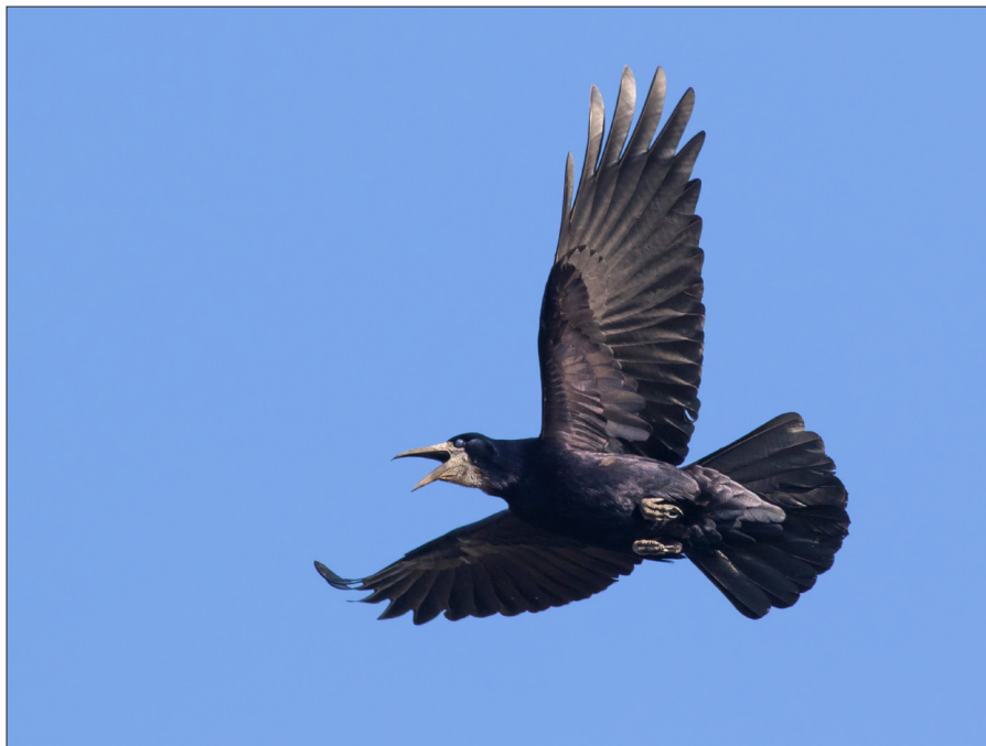
▲ Roeken hebben een rijk sociaal leven, en dat is vaak goed te horen. (Garry Bakker)

Midden jaren zeventig vestigden zich enkele paren op Putten langs de Groene Kruisweg tussen Geervliet en Heenvliet. Rob Strucker voerde 35 jaar