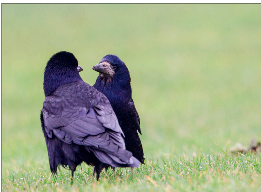
▲ Een koppel Rotterdamse roeken langs de Waalhavenweg, Heijlplaat 18 januari 2015. (Arie Buurman)

onderzoek uit naar deze kolonie en haar dependances op IJsselmonde. Hopelijk komt hij er binnen afzienbare tijd toe zijn bevindingen te publiceren. De paar foeragerende roeken in de berm van de A15 op Rozenburg en/of in het westen van de Hoeksche Waard rond Nieuw-Beijerland zullen afkomstig zijn geweest uit de Geervlietse nederzetting of van haar dependances in de buurt. Maar met enkele trekkers en die paar nesten in West waren ze in de Hoeksche Waard in ieder geval zo schaars dat waargenomen roeken prompt op de vogelwaarnemings-site van de streek terecht komen. Op Goeree-Overflakkee was dat niet anders.