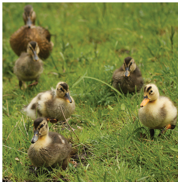
Een vrouwtje soepeend met haar bont gekleurde kuikens. Veenendaal, 11-04-2017.

De verspreiding van de soepeend komt voor een groot deel overeen met die van de wilde eend, maar de soepeend heeft een sterkere afneming met de stedelijke omgeving. (Bron: Sovon Vogelatlas)