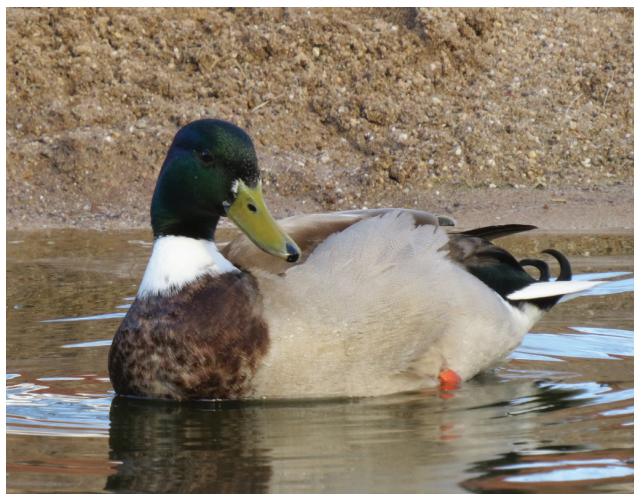
Een mannetje soepeend met een brede witte kraag en vlekkerige borst. Amsterdam, 16-04-2016.

Volgens de trendberekeningen van Sovon gaat de soepeend in de laatste 10 jaar matig achteruit. Daarmee volgt hij de trend van de wilde eend, die al sinds de jaren '90 afneemt. Soms wordt gespeculeerd dat de vermenging met soepeenden een rol speelt bij de achteruitgang van de wilde eend, maar het is niet duidelijk welk mechanisme daarachter zou zitten. Mogelijk vallen de gele kuikens met soepeendengenen sneller ten prooi aan roofdieren omdat ze meer opvallen, maar dit moet nog onderzocht worden. Vanwege het feit dat soepeenden soms moeilijk te onderscheiden zijn van wilde eenden, is bovendien de vraag hoe betrouwbaar de telgegevens zijn. Vaak worden alleen eenden met een extreem afwijkend verenkleed als soepend genoteerd.