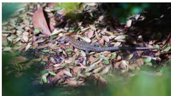
Levendbarende hagedissen.