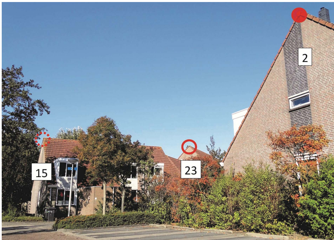
Zeewinde. Drie invliegplaatsen onder de nok. De bestaande nestplaats 2, de verkende plek 15 en de mogelijk nieuwe nestplek 23.