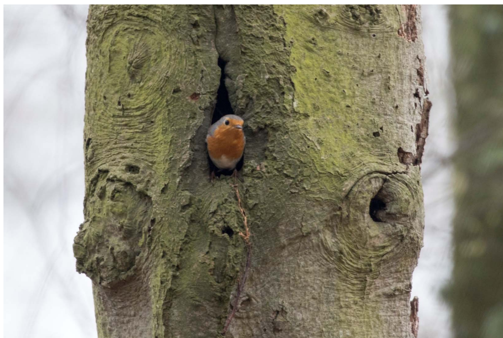
Roodborst in holte

In de tabel worden de aantallen territoria per soort genoemd. Bovendien zijn de aantallen uit de jaren 2002 en 2008 toegevoegd. Ze zijn afgeleid van de inventarisaties van Pim Nobel van Sovon (2002) en van Rien Sluijs en Jelle van Dijk van onze vereniging (2008). Deze inventarisaties hadden betrekking op het gehele gebied van Nieuw Leeuwenhorst en zijn uitvoerig gerapporteerd in De Strandloper. De toenmalige rapportages van het zuidelijke deel zijn in onderstaande tabel gecorrigeerd voor de oorspronkelijke plotgrenzen.