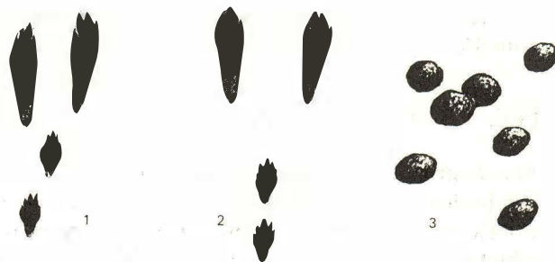
Sporen van de aanwezigheid van een konijn: 1. sporen van een rustig voortgaand konijn, 2. van een rennend konijn; 3. uitwerpselen

Hiermee was het feest nog niet ten einde. Alle deelnemertjes en hun begeleiders werden getrakteerd op een gratis consumptie aangeboden door Dijk en Burg Classic. In de hier aanwezig prettige sfeer konden kinderen, ouderen en de organisatie zich geen beter slot wensen. De I.V.N. afdeling Noordwijk prijst zich gelukkig met een stuk natuur als het "Nieuw Leeuwenhorst" in de nabijheid en wil ook de stichting "Het Zuid Hollands Landschap" betrekken in het welslagen van dit natuurfeest.