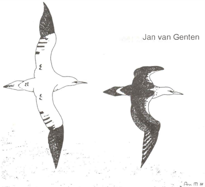
Jan van Genten

Een mogelijk vergiftigde Buizerd werd op 15 september in een tuin langs de Hoogeweg in de Kloosterschuurpolder gevonden. De vogel liet zich vrij gemakkelijk vangen en is naar een vogelopvang in Oegstgeest gebracht. Enkele dagen later is de vogel dood gegaan.