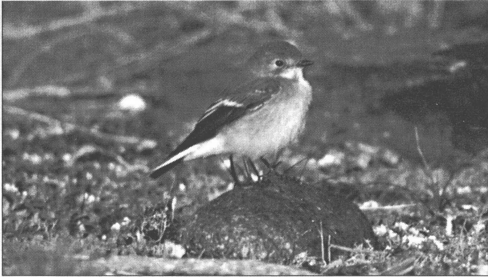
♂ Bonte Vliegenvanger, Norwich Engeland