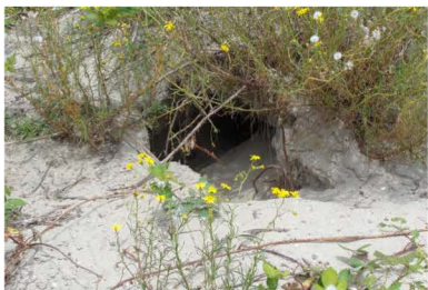
Een konijnenhol op het Natuureiland IJburg

Op het open water zwom een groep Meerkoeten, 1 paar Kuifeend met jongen en 2 paar Futen. In 2016 heeft 1 terreinbezoek plaatsgevonden rond begin juni; er zijn ca. 200 paar Kleine Mantelmeeuwen (80 nesten gevonden, meest met jongen rondom), verder geen Zilvermeeuwen, wel minimaal 6 paar Brandgans, 2 paar Nijlgans, 3 paar Kleine Plevier, 6 paar Witte Kwikstaart en 3 paar Scholekster. Aan dagvlinders Atalanta en Distelvlinder. En tenslotte verscheidene Konijnen en diverse hollen.