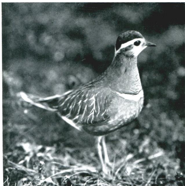
»Där stod han nu åter och blickade troskyldigt.»

Al met al een goede reden om volgend jaar weer attent te zijn.