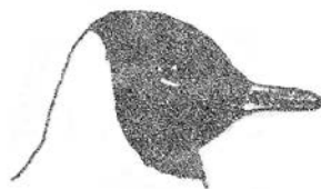
Kokmeeuw (volwassen in zomerkleed)

Maar toen we allemaal nog eens goed keken, bleek dat alles klopte. Hierna gingen we naar de waarnemershut. Er werden Snorren gehoord en Blauwborstjes gezien. Bij Willem I nuttigden we koffie met appelgebak; we verlieten de Oostvaardersplassen en gingen en weg naar de Kievitslanden.