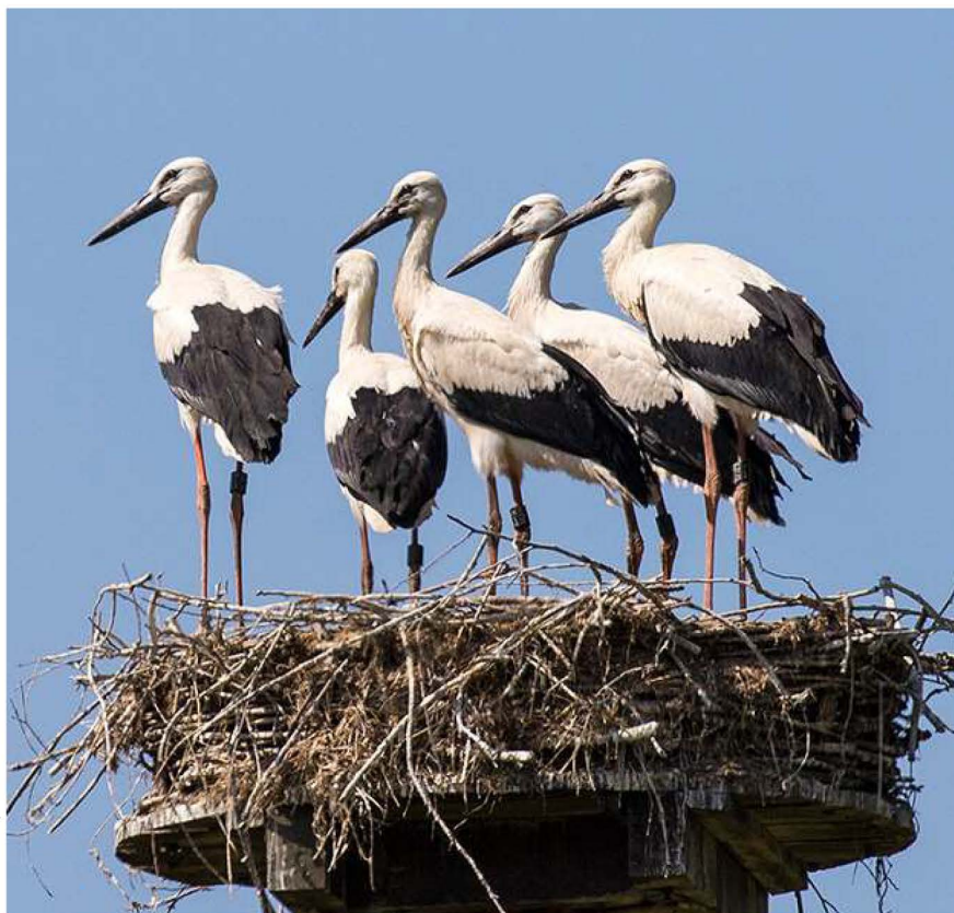
12 JULI 2018