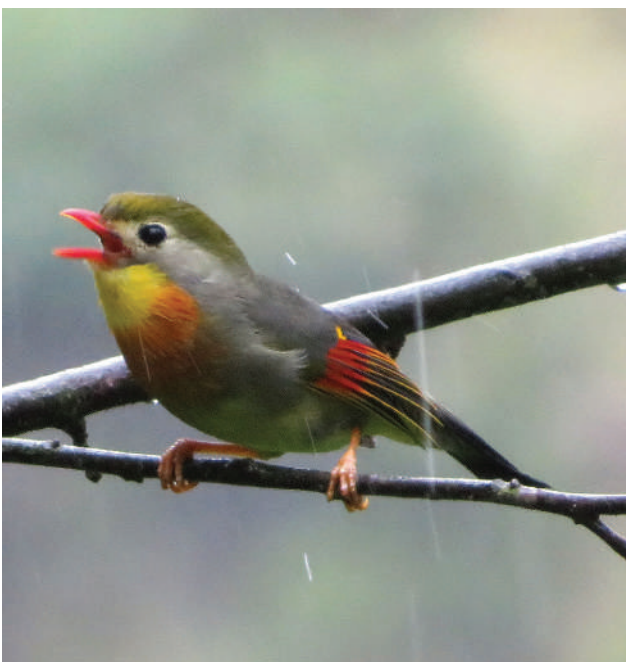
Japanse nachtegaal.

De soort was zeer populair als kooi- en volièrevogel. Er was in Europa een omvangrijke import. Deze is sinds het eind van de jaren negentig gereguleerd. Het is aannemelijk dat deze handel en het houden van vogels via ontsnappingen/vrijlatingen heeft geleid tot introducties in steden en dorpen. Hieruit zijn op meerdere plaatsen grote populaties in het wild ontstaan, zoals in Japan, Réunion en Hawaii. Ook in Europa heeft de soort zich gevestigd als broedvogel: in een achttal regio's in Frankrijk, Italië, Portugal en Spanje (regio Barcelona). Het gaat om steden (groenzones) en bosgebieden. De aantallen zijn er sterk toegenomen, tot meer dan 5.000 broedparen. In sommige regio's van Spanje en Italië is het tegenwoordig zelfs één van de talrijkste vogels. De soort breidt zich vanuit die vestigingskernen uit door dispersie. De verspreiding in Europa is verdubbeld ten opzichte van het vorige decennium.