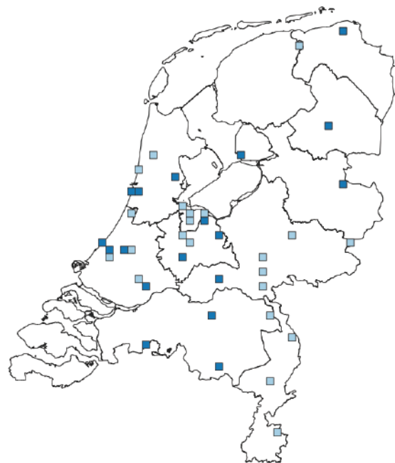
Atlasblokken waar Japanse nachtegaal is gemeld (lichtblauw vóór 2011 en donkerblauw erna).