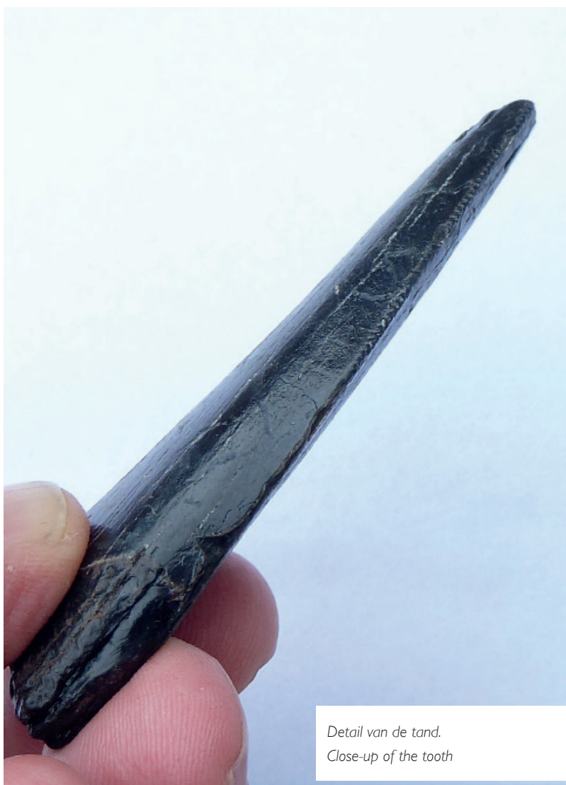
Detail van de tand. Close-up of the tooth

Ook wij mochten niet klagen. Inmiddels hadden wij al veel botten gevonden en konden bijna een skelet van een dier in elkaar zetten. Toen het eerste gedeelte van het strand van de Maasvlakte 2 werd geopend en nog afgegrensd werd met containers waren wij erg blij omdat dit de perfecte plek was om van de zon te genieten en om fossielen te zoeken. Mijn oudste zoon vond tijdens het graven van een vloedberg een stuk schedel van een reuzenhert.