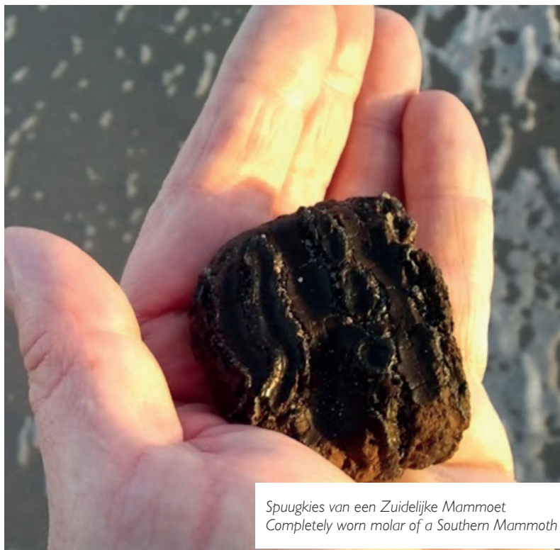
Spuugkies van een Zuidelijke Mammoet Completely worn molar of a Southern Mammoth