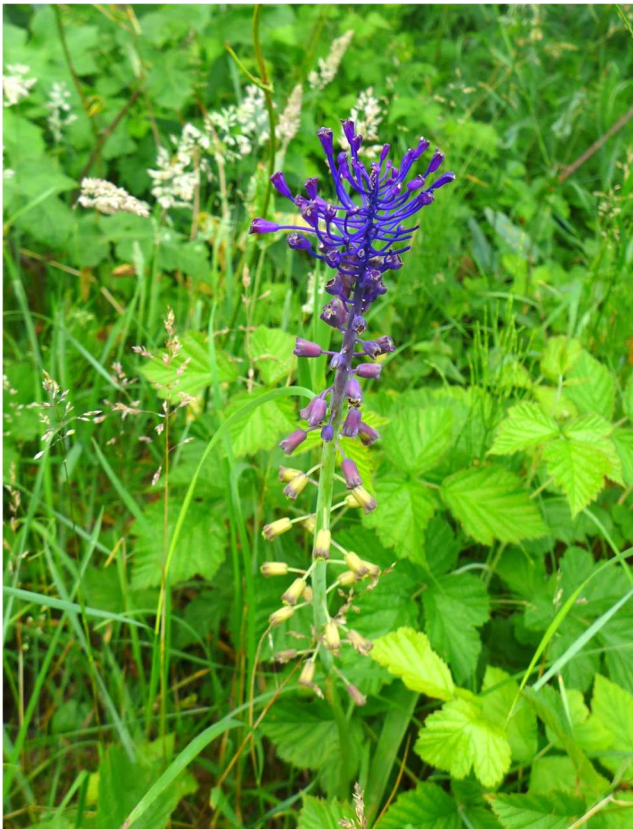
Kuiiphyacint 19 juni 2019 Oosterduinse Meer

In de vorige Strandloper was te lezen welke plantensoorten in 2019 voor het eerst in onze regio waren aangetroffen. Behalve die nieuwkomers zijn er nog heel wat andere bijzondere soorten in 2019 gevonden. In deze bijdrage komen de zeldzame soorten aan bod waarbij het niet gaat om de eerste vondst in onze regio. Voor de volgorde is nu gekozen voor de indeling die te vinden is in de nieuwe Heukels' Flora van Nederland (zie de boekbespreking in de vorige Strandloper). Behalve de volgorde van de families zijn in de nieuwe Flora ook heel wat Nederlandse en wetenschappelijke namen veranderd. In de nieuwe Flora zijn veel meer dan in zijn voorganger veel soorten opgenomen die veelal via het straatmilieu zich in ons land hebben gevestigd. In de onderstaande lijst staan drie soorten waarvan de naam nog niet in de nieuwe Flora is opgenomen. Deze drie soorten zijn aan het eind van de lijst geplaatst.