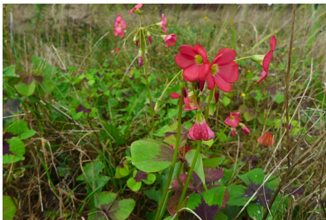
Klavertje vier 1 oktober 2019 Rustoord Lisse

Deze soort is steeds vaker in het stedelijke milieu te vinden zoals in juli op het braakliggende terrein bij Rustoord in Lisse.