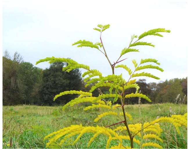
Valse christusdoorn 14 oktober 2019 Sint Bavo

Amerikaanse amberboom Liquidamber styraciflua Op Sint Bavo in Noordwijkerhout zijn twee jaar geleden vrijwel alle bomen gekapt in het gedeelte tussen het hoofdgebouw en de Engelse tuin. Daarbij waren ook enkele Amerikaanse amberbomen. In het najaar van 2019 bleken hier tientallen zaailingen opgeslagen te zijn.