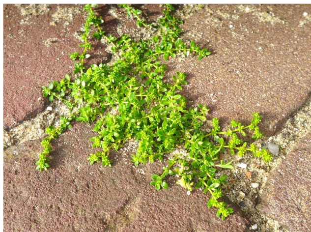
Glad breukkruid 20 juni 2019 camping De Noordduinen

een plantje dat op veel plaatsen in Leiden (o.a. de componistenwijk) tussen de straatstenen groeit.