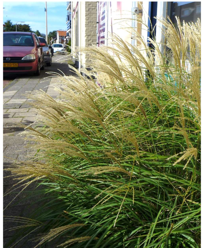
Klein prachtriet 30 augustus 2019 Achterzeeweg Noordwijk

In september groeide deze soort op Oud-Leeuwenhorst op het veldje waar eerder een boerderij had gestaan.