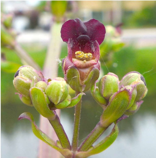
Geoord helmkruid 7 juni 2019 Duinwetering Noordwijk

Geoord helmkruid Scrophularia auriculata In juni groeide een forse pol van dit helmkruid langs de Duinwetering. Het was pas de tweede vondst voor de gehele Duin- en Bollenstreek. De eerst bekende groeiplaats ligt langs de trekvaart bij De Zilk.