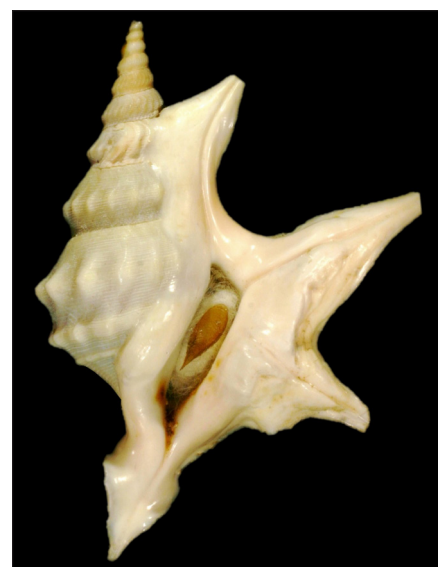
▲ Een pelikaansvoet uit de collectie van Het Natuurhistorisch, NMR 9930-31993.

De oude Straatgrassen maken je nieuwsgierig. Zo vraagt de leek zich af of de kelderkever kwaad kan, of het verstilde wespennest kan leiden tot een