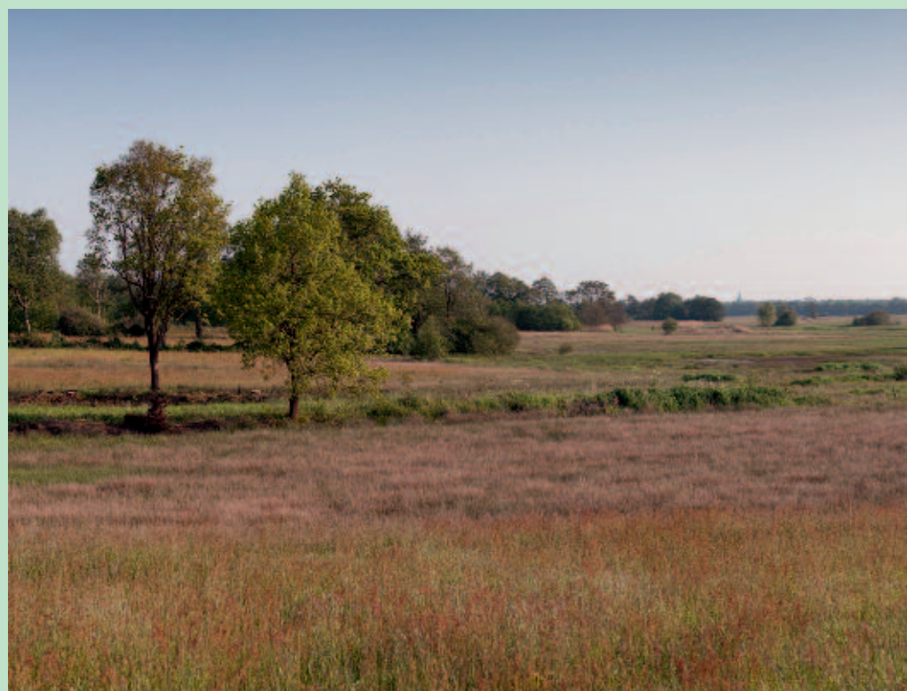
Foto 1. Het beekdal van het Gasterensche diep bij het Ballooërveld met vochtige hooilanden.