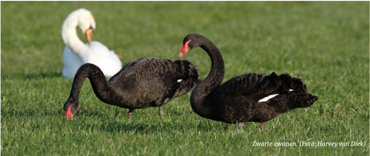
Zwarte zwanen.

De zwarte zwaan ( Cygnus atratus ) is oorspronkelijk uit Australië afkomstig. Het is een populaire siervogel en ten gevolge van ontsnappingen/vrijlatingen zijn hieruit in meerdere Europese landen verwilderde populaties ontstaan. Sinds 1978 broedt deze soort in Nederland. Jarenlang namen de aantallen toe. Over deze soort is eerder geschreven in Kijk op Exoten 9 (2014). Hier volgt een update over het voorkomen van de soort sindsdien. Tevens besteden we aandacht aan een nieuwe exotische zwanensoort voor Nederland: de zwarthalszwaan ( Cygnus melancoryphus ).