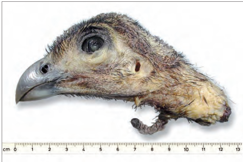
▲ De kop die in het jaar 2000 aantoonde dat het Bruijns boshoen nog op Waigeo voortleeft. Collectie Natuurhistorisch Museum Rotterdam, NMR 9989-001605.

orde van St. Anna van Rusland; Commandant in de orde Jezus Christus van Portugal; Ridder 3 e klas in de orde van de Kroon van Pruisen en Officier van de Italiaanse Kroon. Waarom hij deze buitenlandse onderscheidingen ontving, is onbekend; de Russische decoratie kreeg hij vermoedelijk in verband met een bezoek van de Russische kroonprins aan Nederlandsch-Indië.