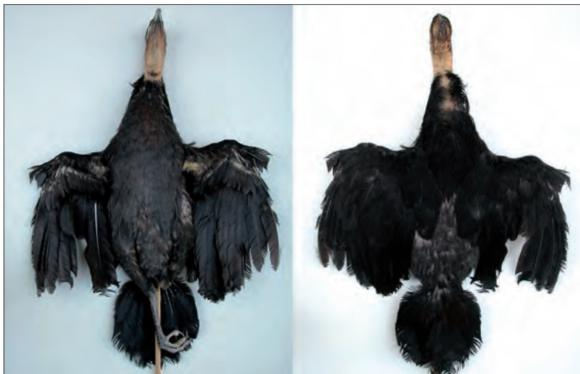
▲ Het eerste en voorlopig enige complete exemplaar van Bruijns boshoen dat na 1938 werd verzameld. Collectie Natuurhistorisch Museum Rotterdam, NMR 9989-001606.