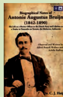
▼ Tabel 1 Namen van diersoorten die vernoemd zijn naar Antonie Augustus Bruijn.

Het Engelstalige boek over Antonie Augustus Bruijn (147 ruim geïllustreerde pagina's, paperback) is voor 10 euro te koop in de Museumwinkel. Voor 13,50 ontvangt u het per post thuis; maak het bedrag daartoe over op bankrekening 511071 t.n.v. Natuurhistorisch Museum Rotterdam o.v.v. 'boek Bruijn'. Vergeet niet uw adres te vermelden.