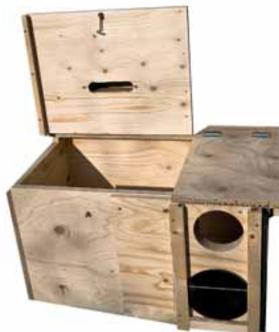
Kast met geopend deksel en geopend invlieggat. In het deksel is de gleuf van de ventilatieopening te zien.