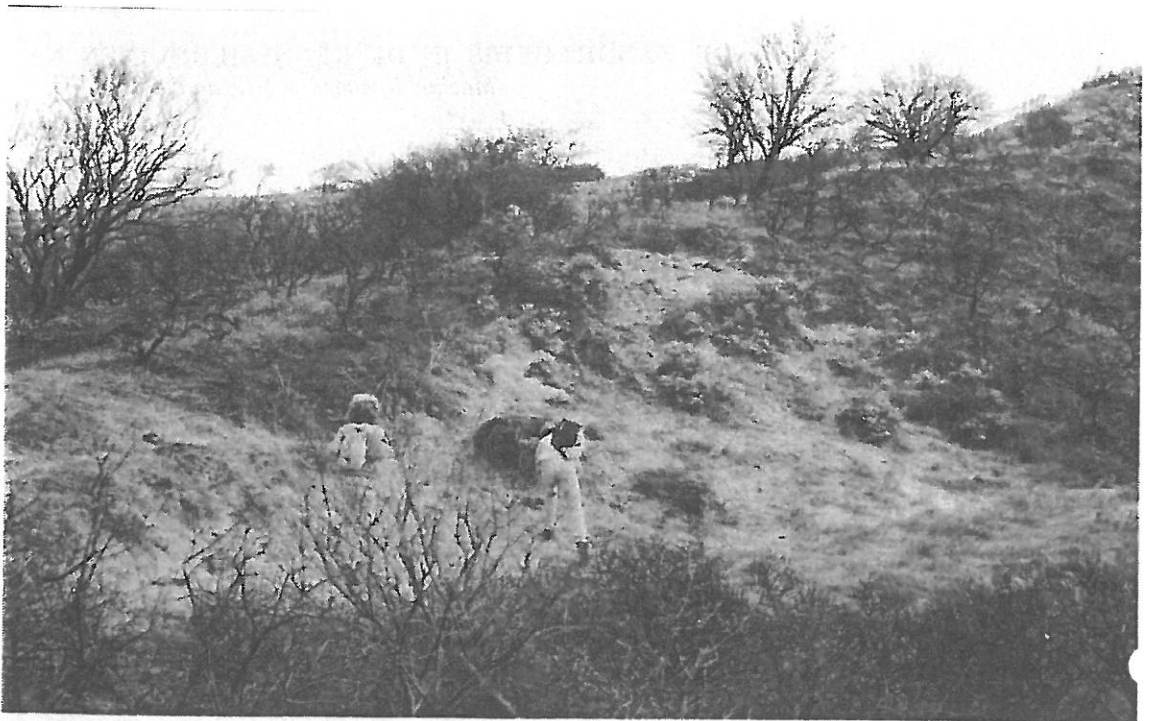
De auteurs aan het werk in de kuil waar het vuur 'overheen was gegaan'. Vindplaats van 433 eidoppen. Oktober, 1994.