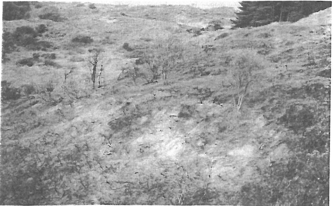
Vindplaats van uitgekomen eitjes op de verbrande helling, oktober 1994

behoorlijk begroeid. De verhouding tussen juvenielen en adulten is waarschijnlijk verstoord en dus zullen er een aantal jaren minder eieren gelegd worden. Dit hoeft voor een populatie van lang levende dieren geen grote gevolgen te hebben. Bovendien kunnen hagedissen van elders zich vestigen op de opengevallen plaatsen. Wij vermoeden dat de hagedissen-populatie in dit gebied niet vernietigd is, maar een nieuwe start doormaakt. Er hoeft dus niet gevreesd te worden voor de hagedissenpopulatie in het verbrande deel van de Kennemerduinen.